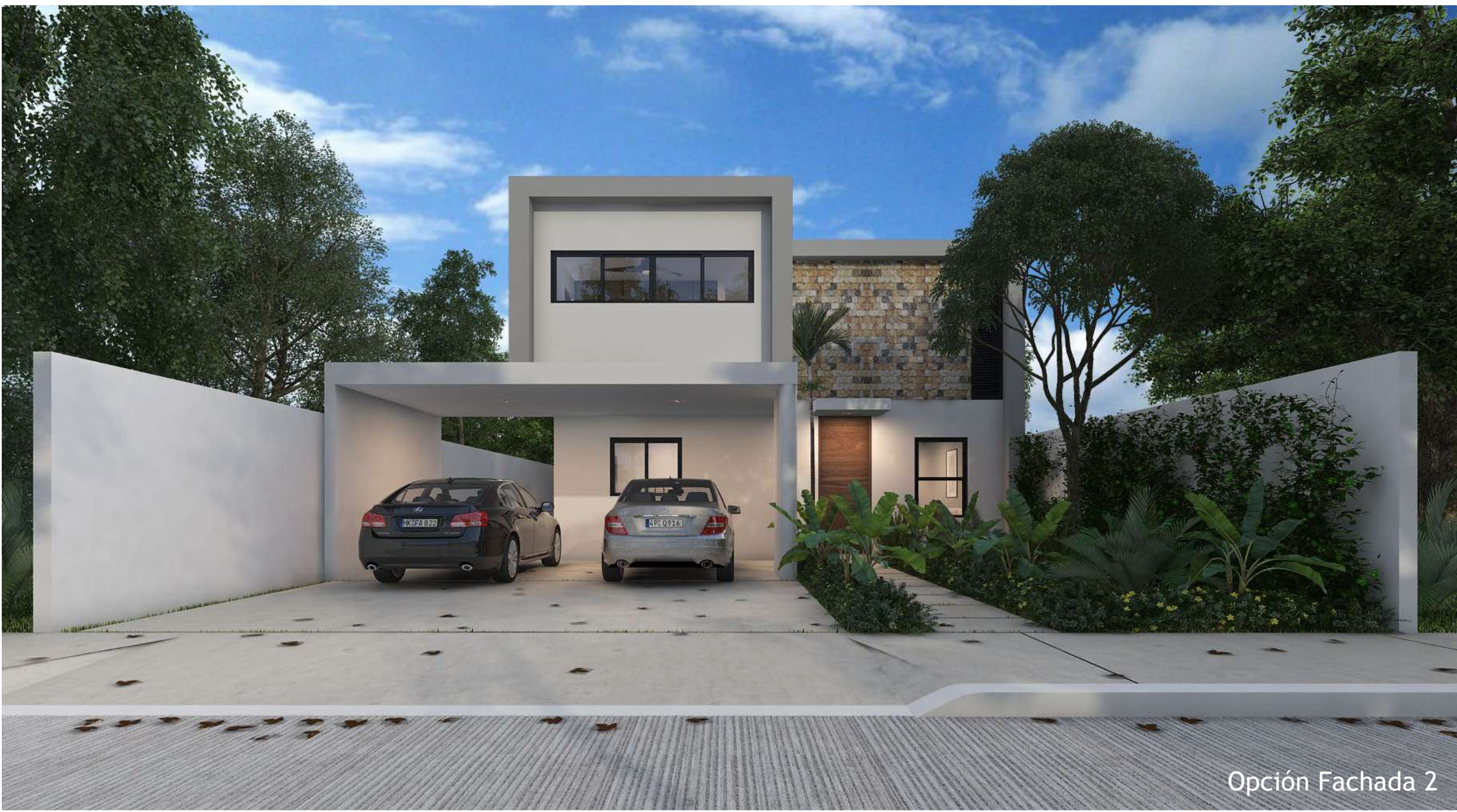
Opción Fachada 2