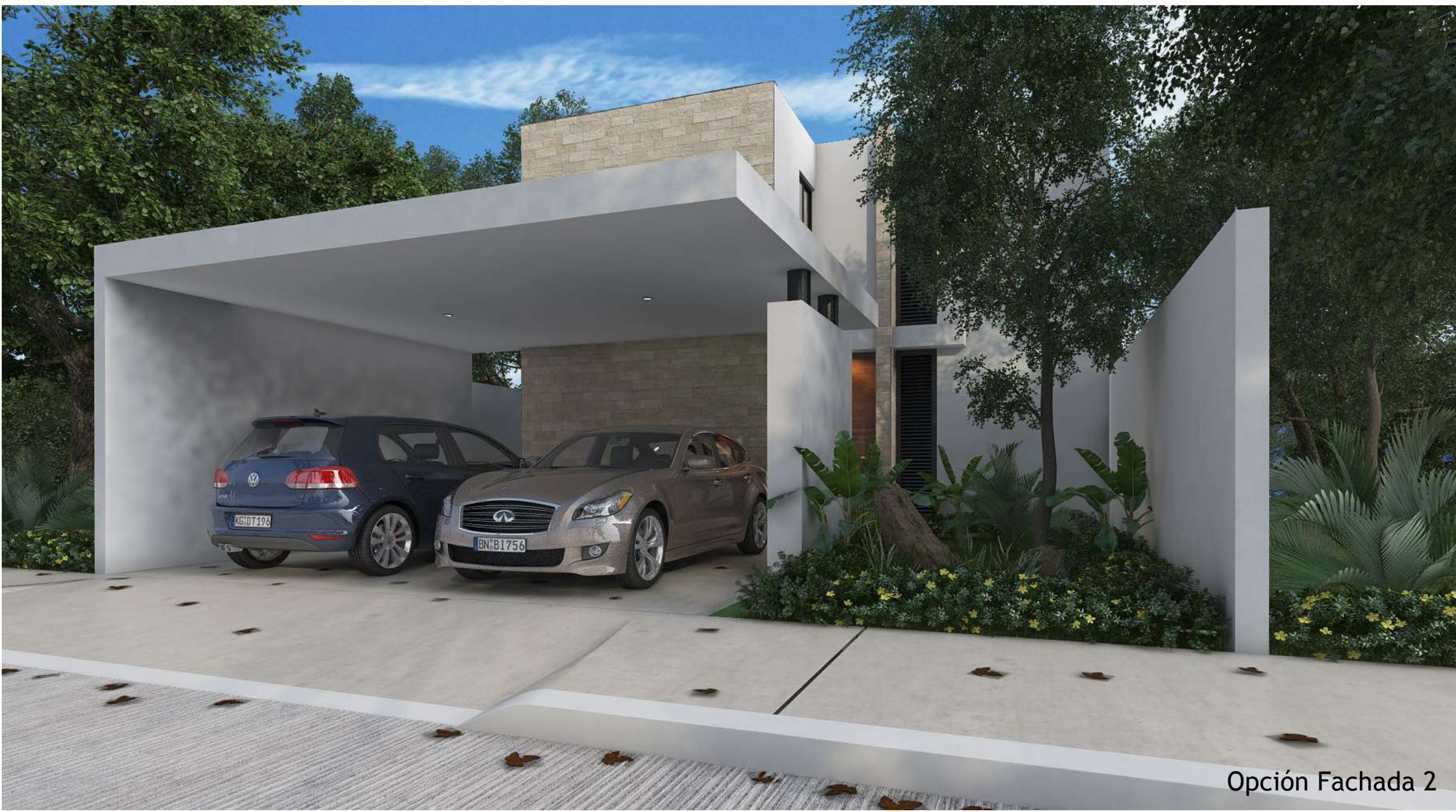
Opción Fachada 2