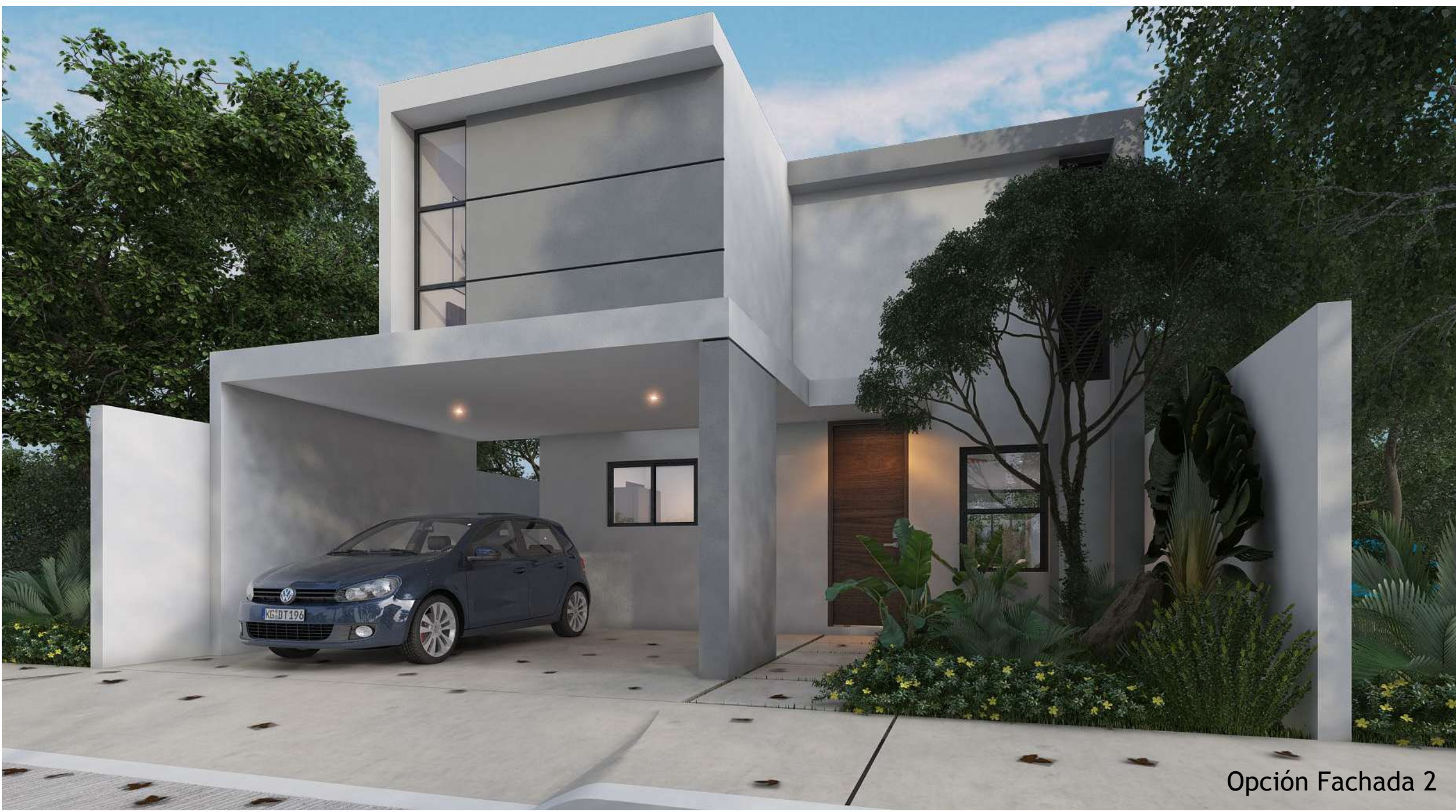
Opción Fachada 2