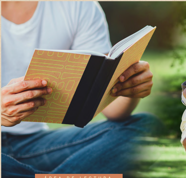
ÁREA DE LECTURA