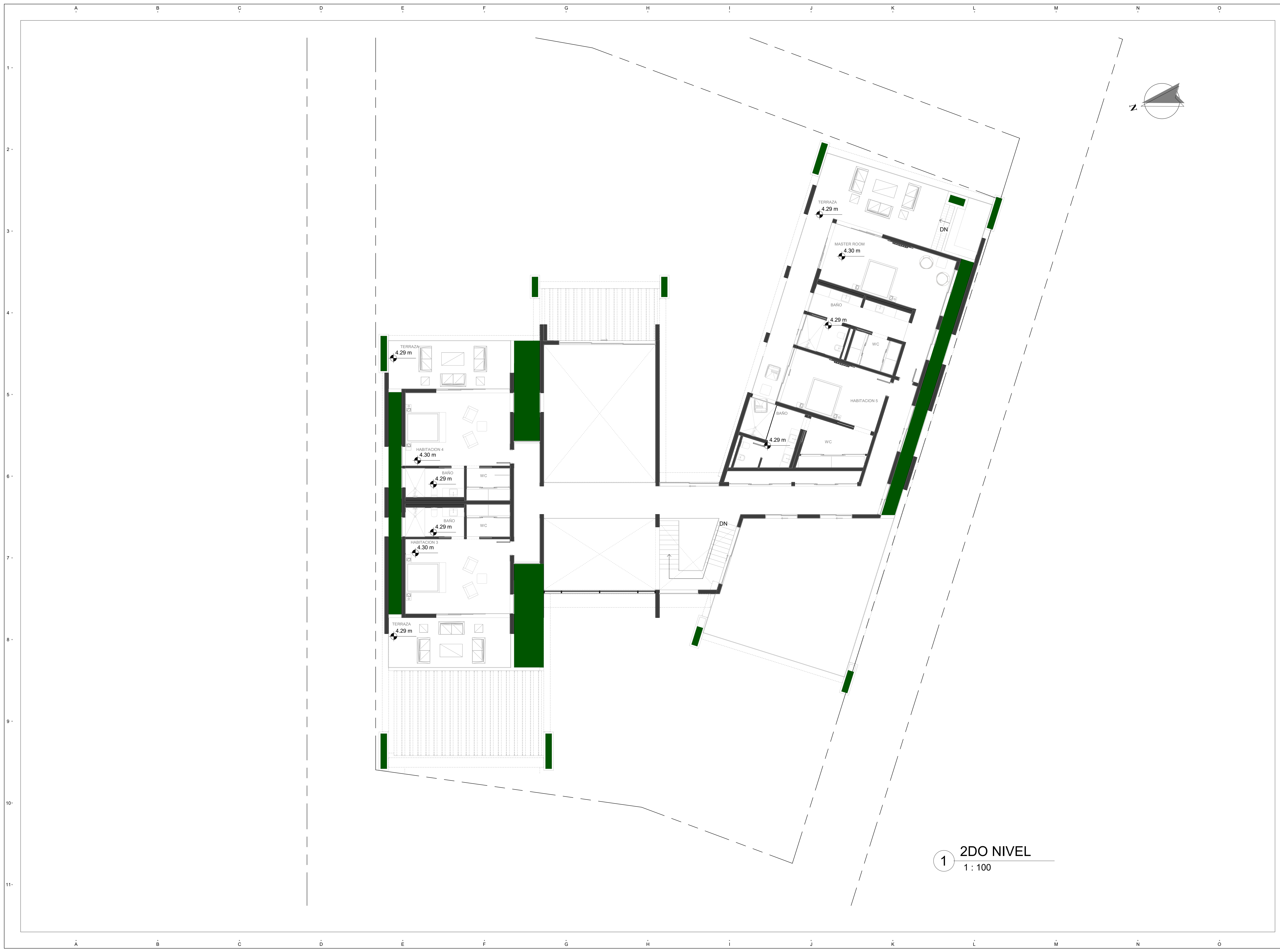
1 2DO NIVEL 1 : 100