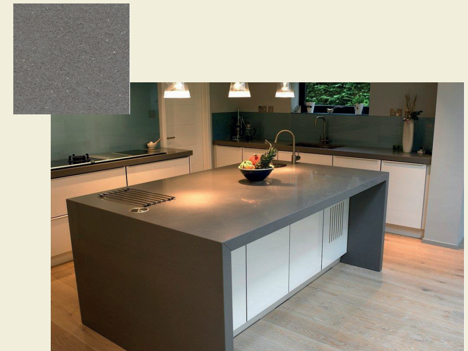
Cubierta gris o similar, Silestone.