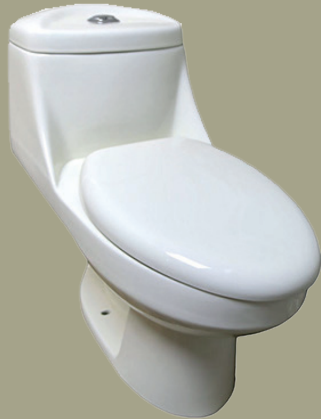
Wc, Neo Urrea o similar.