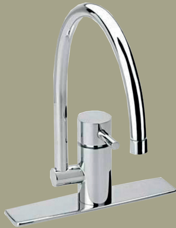
Grifo para fregadero de cocina o similar.