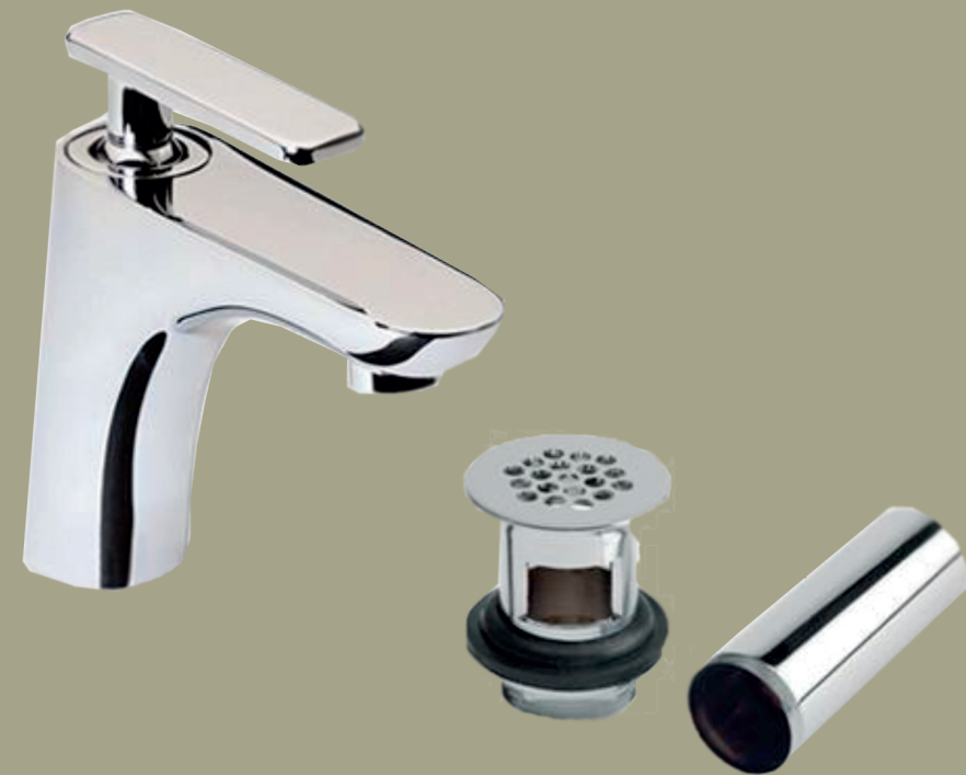
Grifo. Proycta Integra Select o similar.