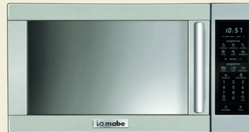
Microondas IO Mabe o similar.