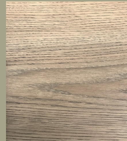
Carpintería de madera de roble, según muestra aprobada o similar