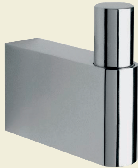
Gancho Proyecta Integra Select o similar.