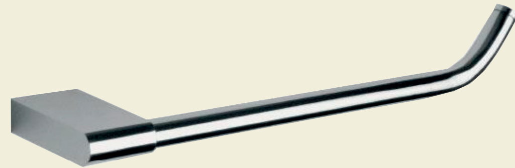
Porta toallas de mano. Proyecta Integra Select o similar.