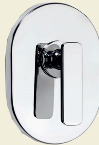
Mezclador de ducha. Proycta Integra Select o similar.