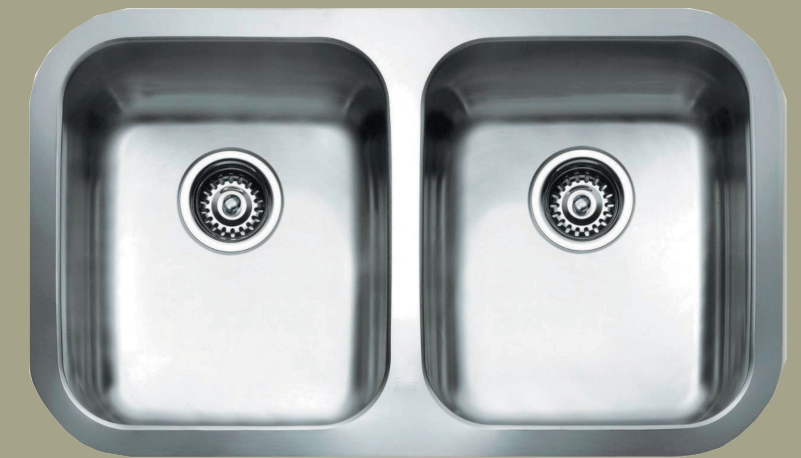
Fregadero doble bajo montaje para 3 dormitorios y penthouses o similar.