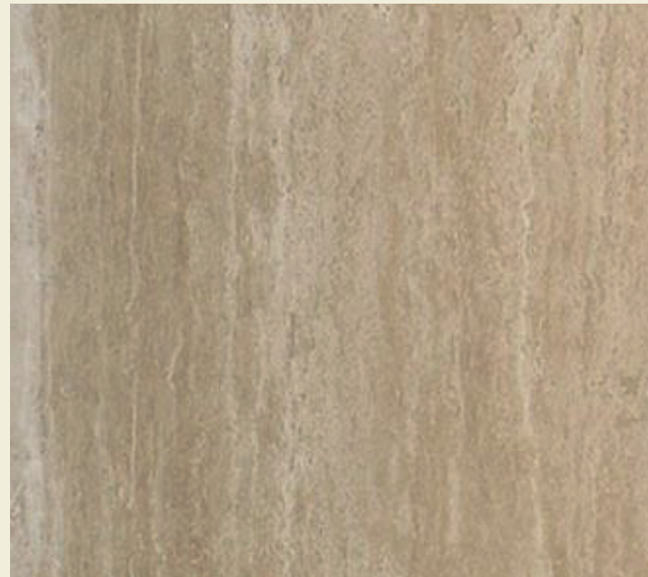
Marmol pulido o similar.