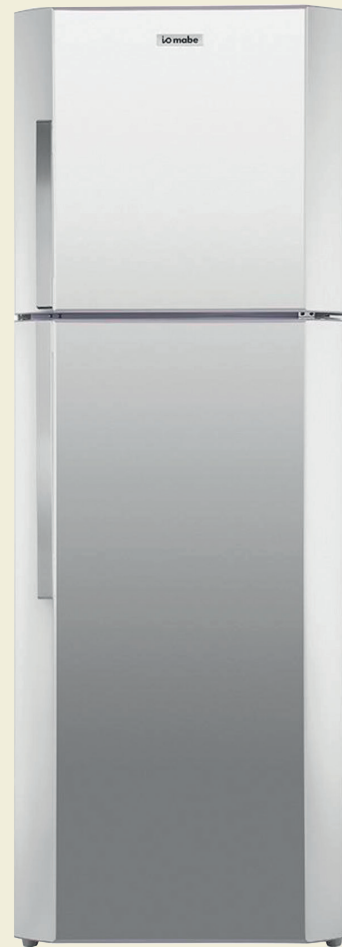
Refrigerador Top M IO Mabe o similar.