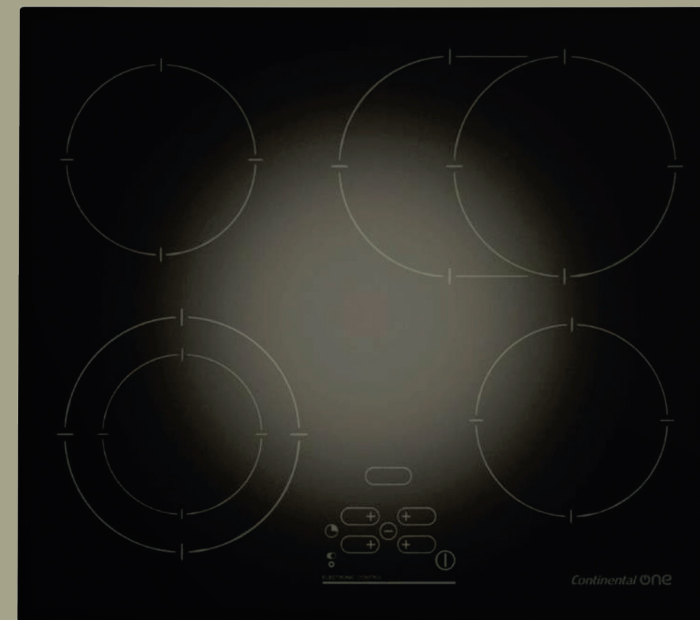
Electric Cooktop. IO Mabe (Para condos mayores a 90 M2) o similar.