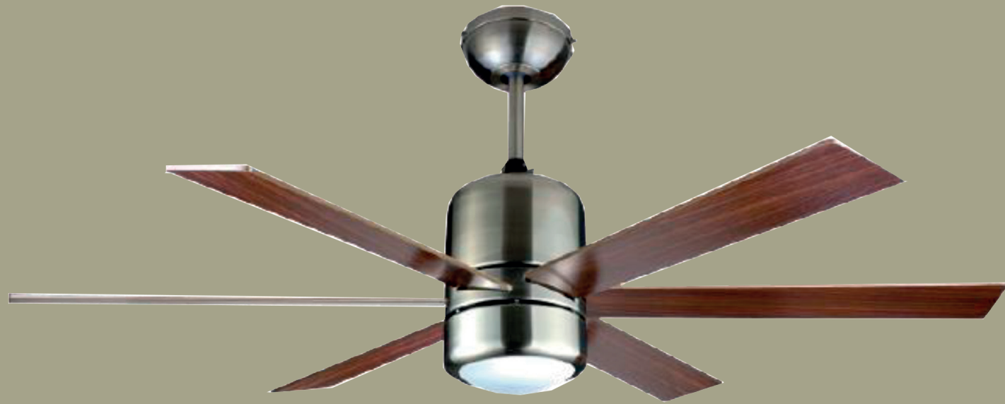
Ventilador, color chocolate o similar