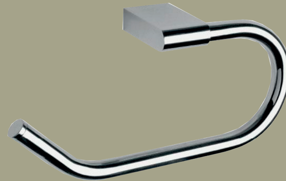
Soporte para pape higienico. Proycta Integra Select o similar.