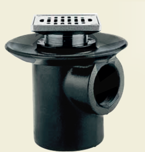
Drenaje de ducha o similar.