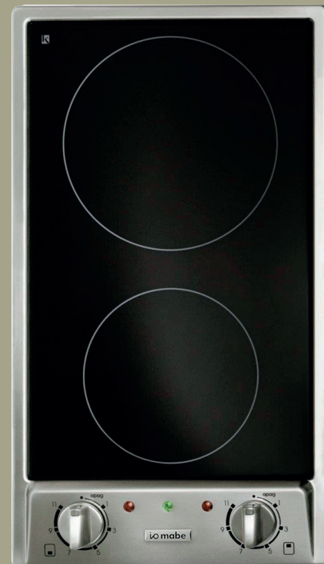
Cocina Eléctrico IO Mabe 30 (Para condos menores a 90 M2) o similar.