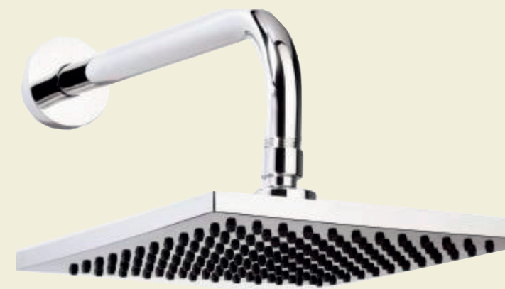
Ducha. Proyector Integra Select o similar.