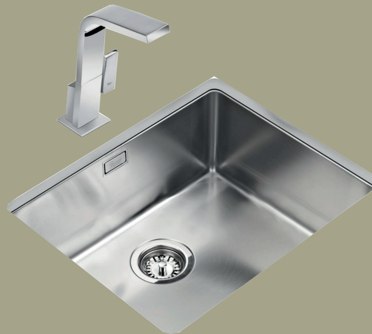
Fregadero de cocina bajo montaje 1 y 2 dormitorios o similar.