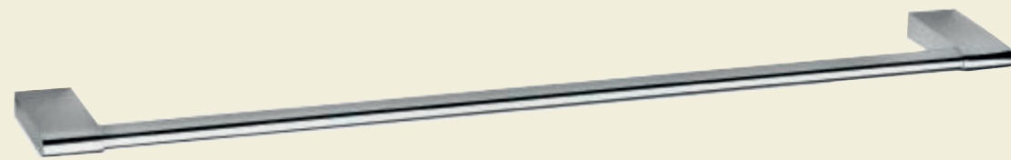
Porta toallas de ducha. Proycta Integra Select o similar.