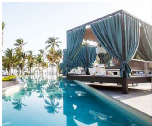
Pearl Beach Club