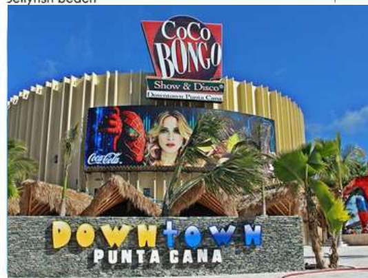
Coco Bongo & Downtown Mall