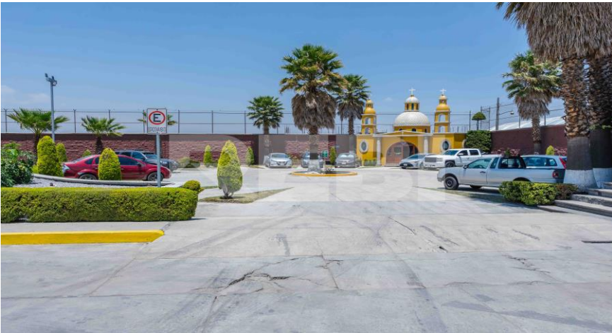
Área de estacionamiento y capilla