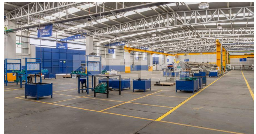
Área de producción