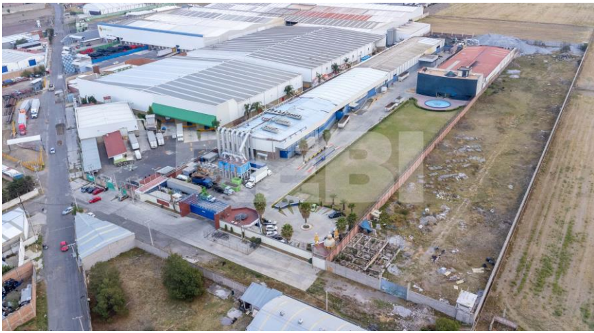
Fotografía Aérea de la Propiedad

Oportunidad para la adquisición una propiedad industrial con una superficie de 10,365 m 2 ubicada en Zona Industrial Chalco, Estado de México.