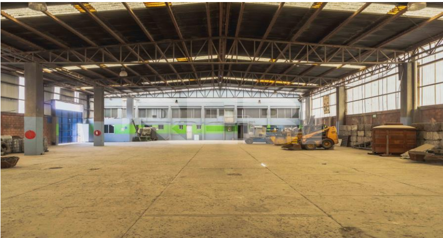
Área de almacén de producto