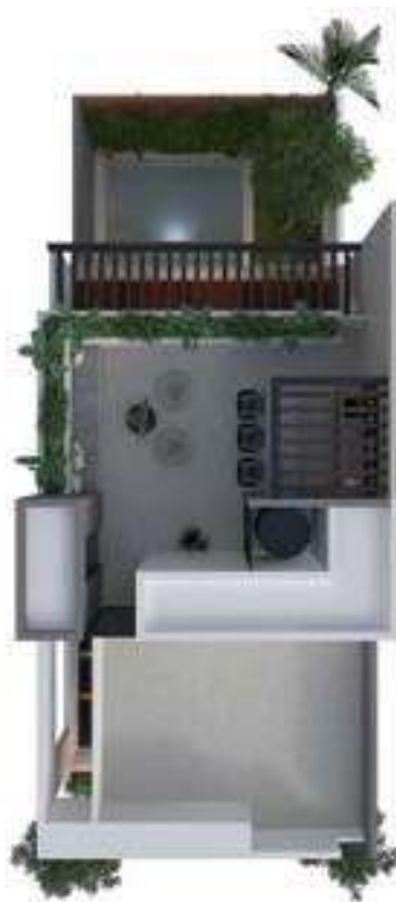
PLANTA DE CONJUNTO