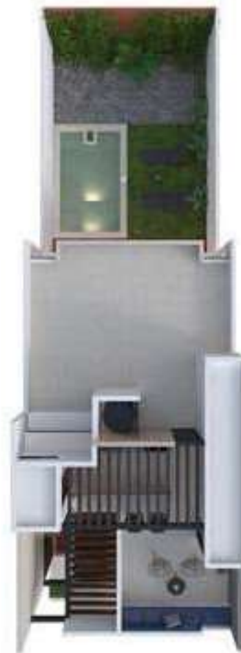
PLANTA DE CONJUNTO