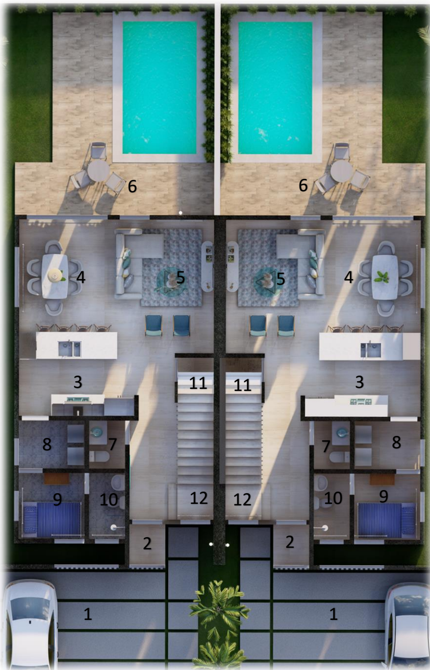
PLANTA ARQ. 1 ER. NIVEL