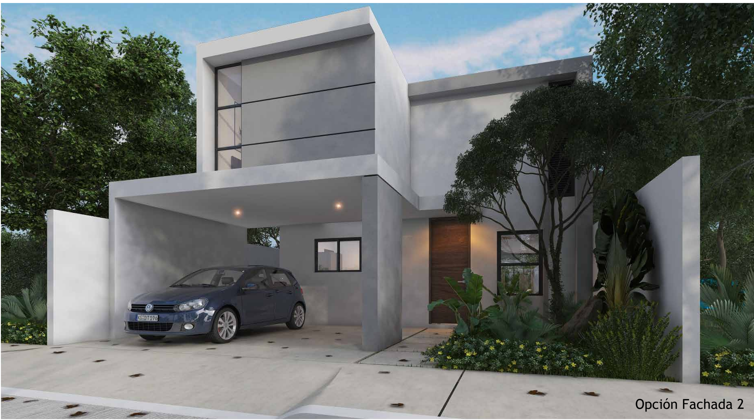
Opción Fachada 2