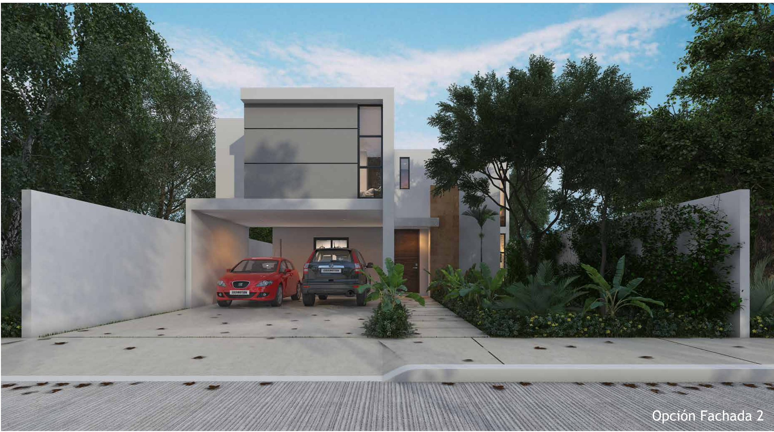
Opción Fachada 2