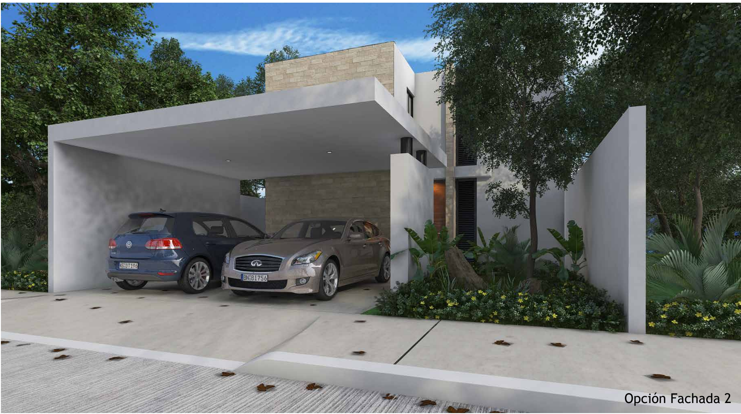
Opción Fachada 2