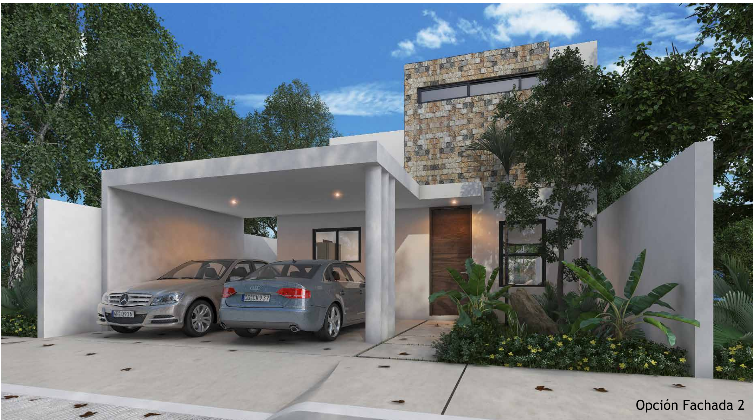
Opción Fachada 2