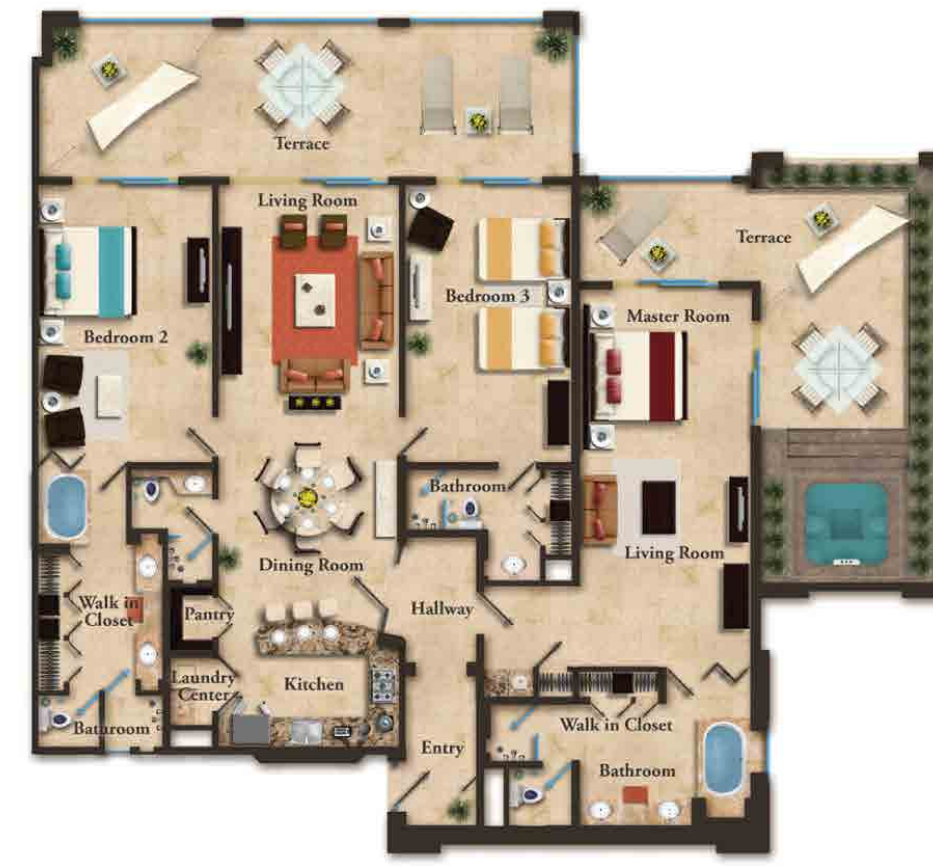
RESIDENCIA CON VISTA AL OCÉANO