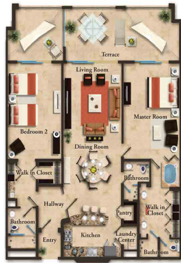
RESIDENCIA CON VISTA AL OCÉANO