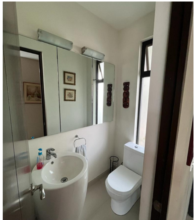
Baño de visitas