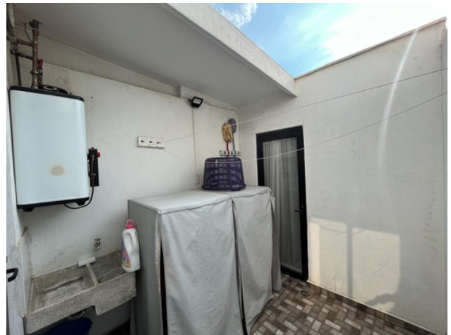
Área de lavado