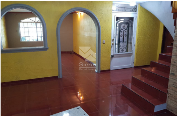
VISTA DESDE COMEDOR