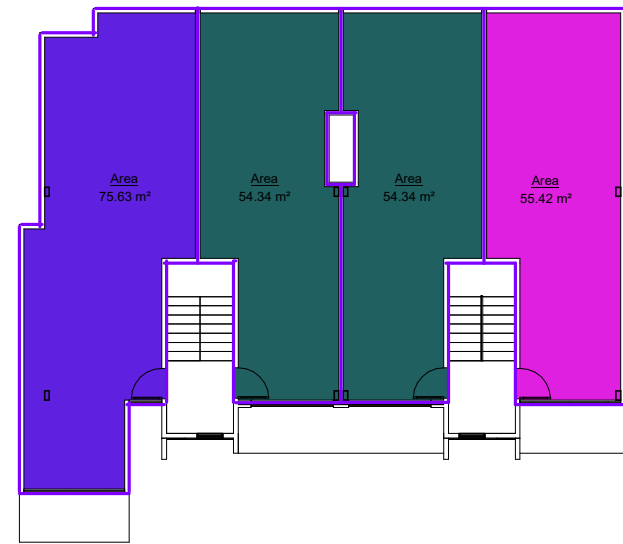
ÁREA DE CONSTRUCCIÓN