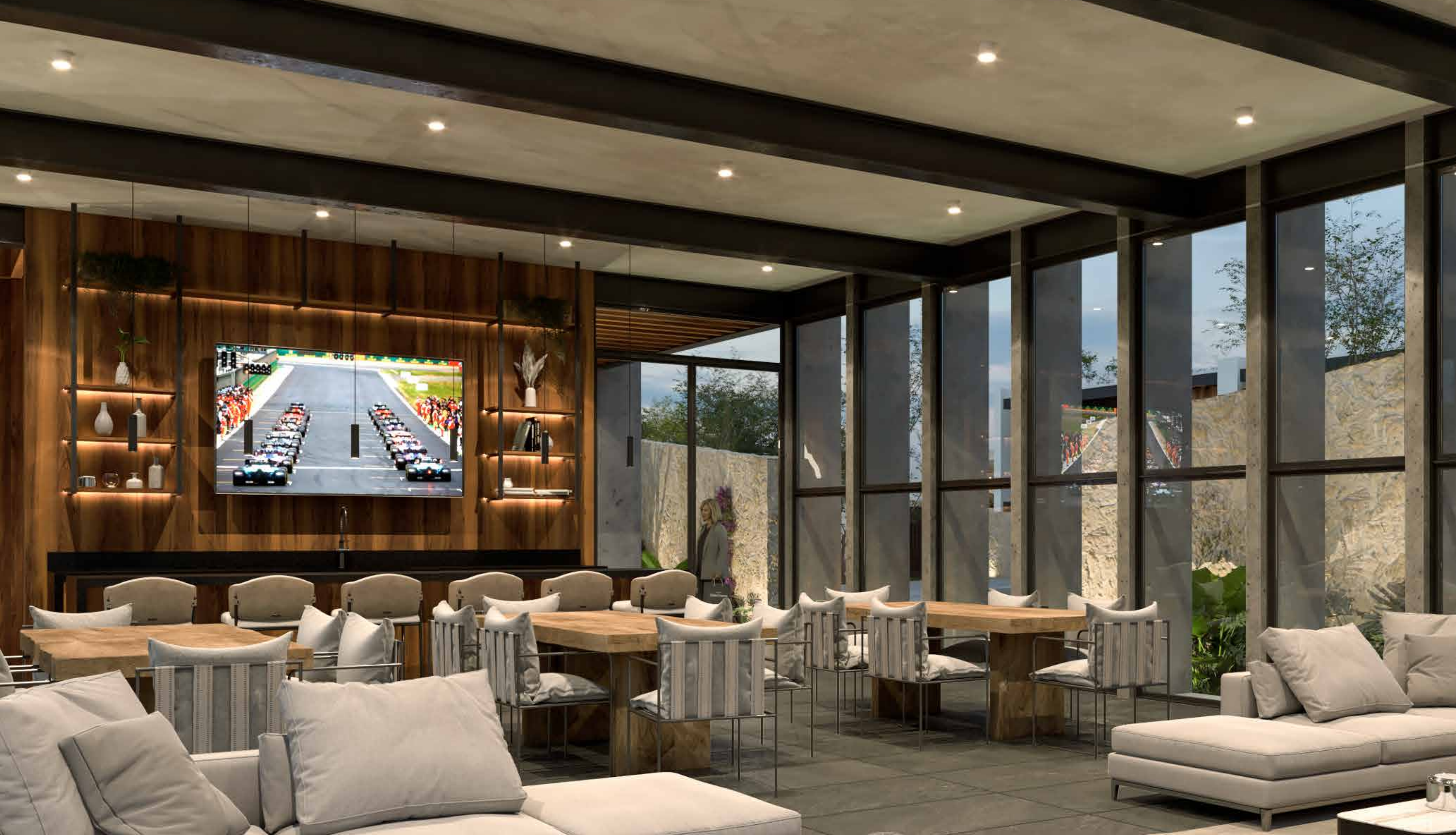
RENDER SPORT BAR