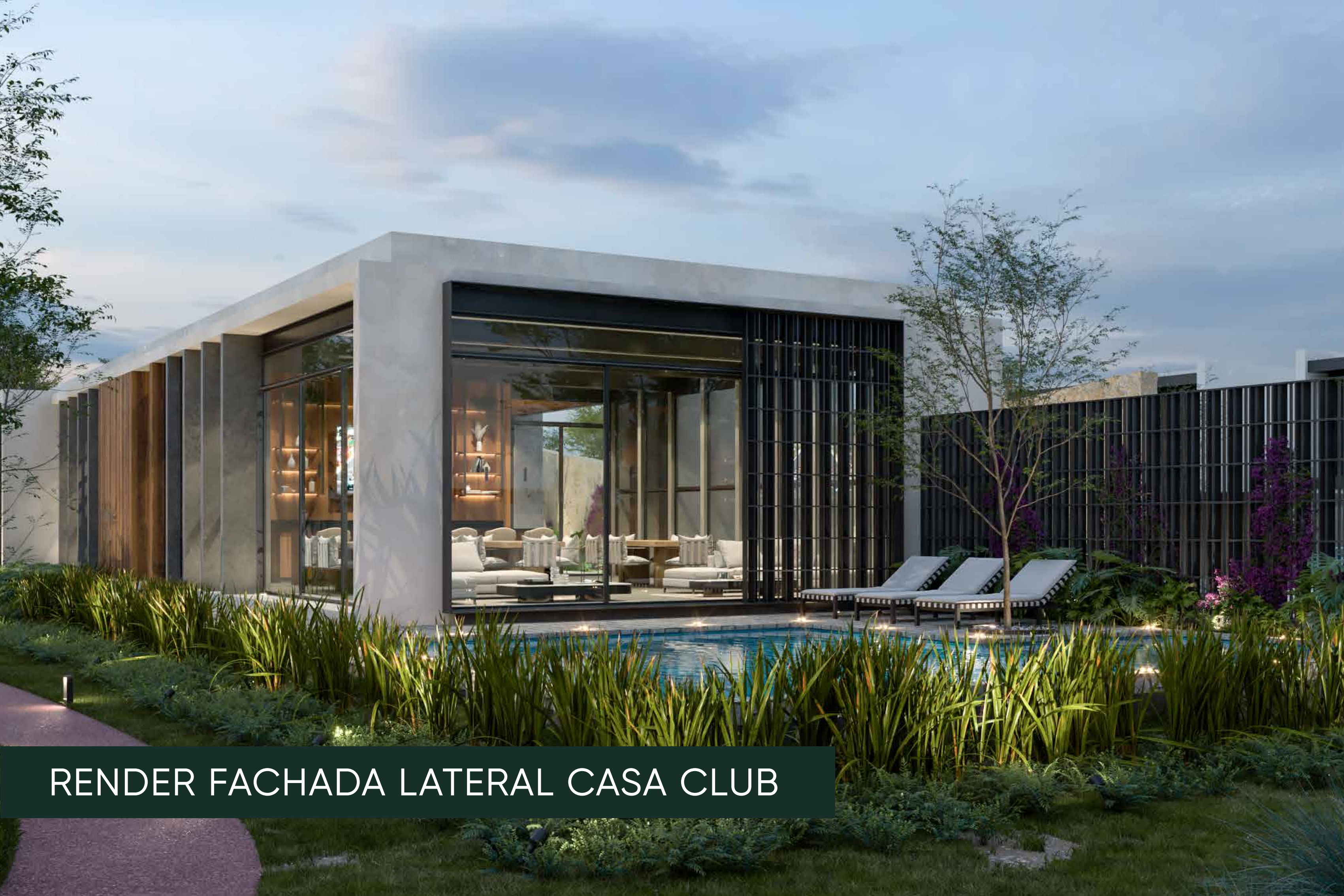
RENDER FACHADA LATERAL CASA CLUB