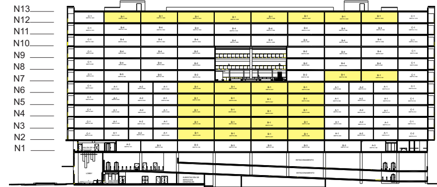
UBICACIÓN EN LA TORRE