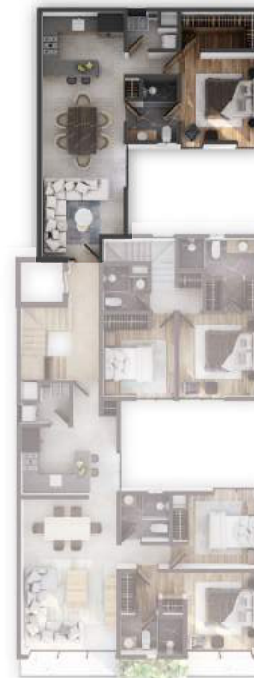
PLANTA NIVEL 4