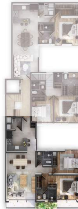
PLANTA NIVEL 2

2 Recámaras 2 Baños Balcón 1 Estacionamiento