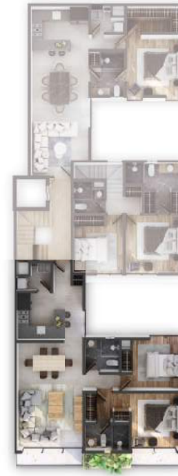
PLANTA NIVEL 6