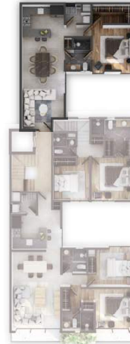
PLANTA NIVEL 6