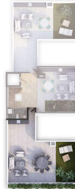
PLANTA NIVEL RG