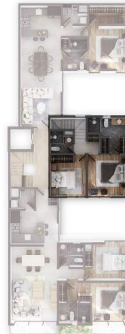
PLANTA NIVEL 2