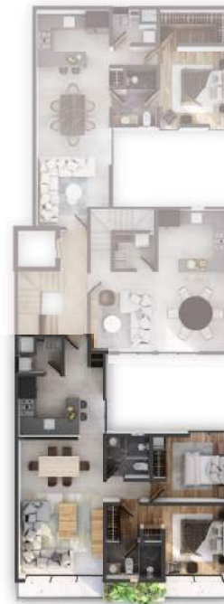
PLANTA NIVEL 5