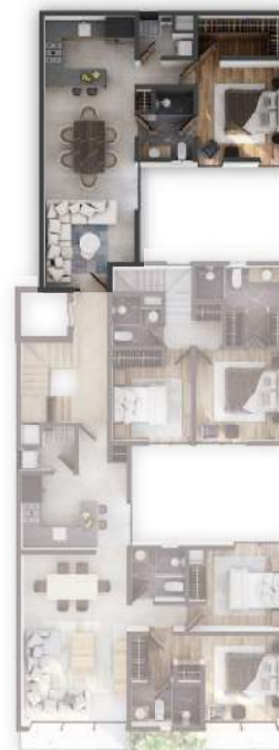
PLANTA NIVEL 2