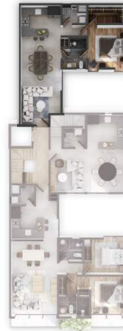
PLANTA NIVEL 5