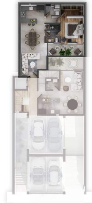
PLANTA NIVEL 1