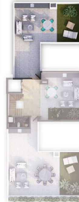
PLANTA NIVEL RG