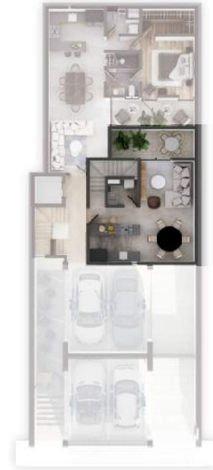
PLANTA NIVEL 1