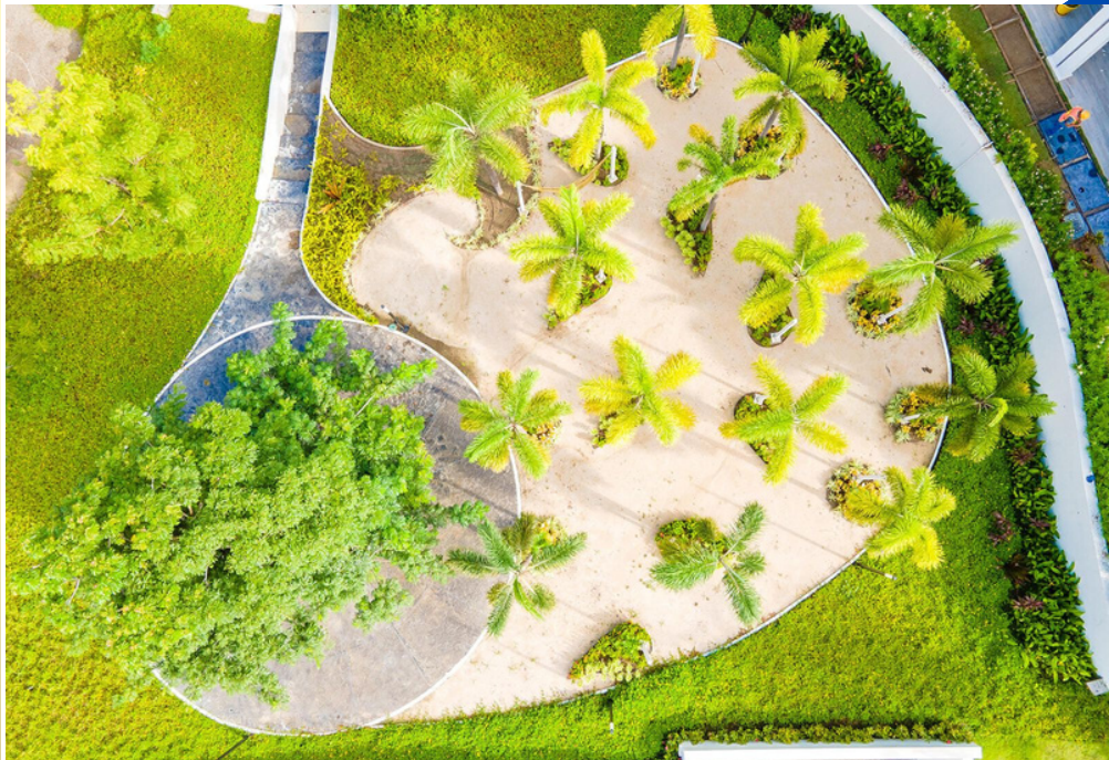
AMPLIAS AREAS VERDES, ANDADORES Y ESTACIONAMIENTOS.