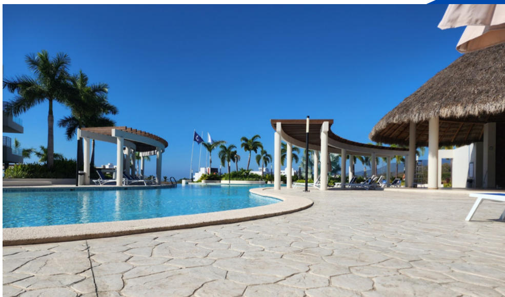
RESTAURANTE Y BAR EN EL ÁREA DE PALAPA