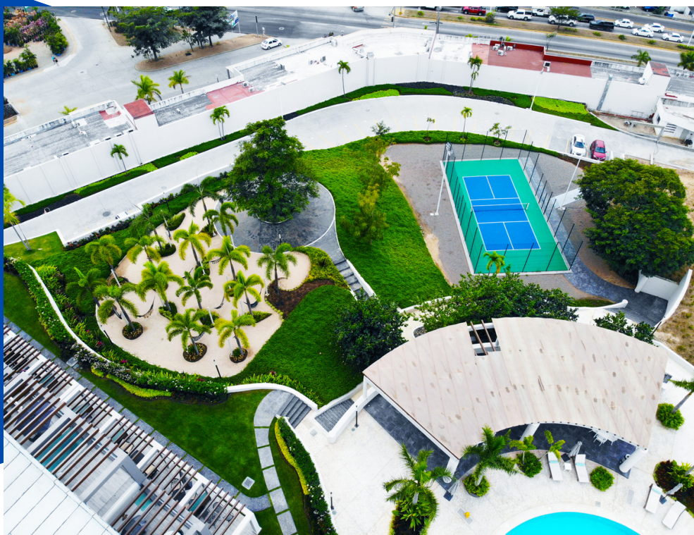
CANCHA DE PICKLEBALL