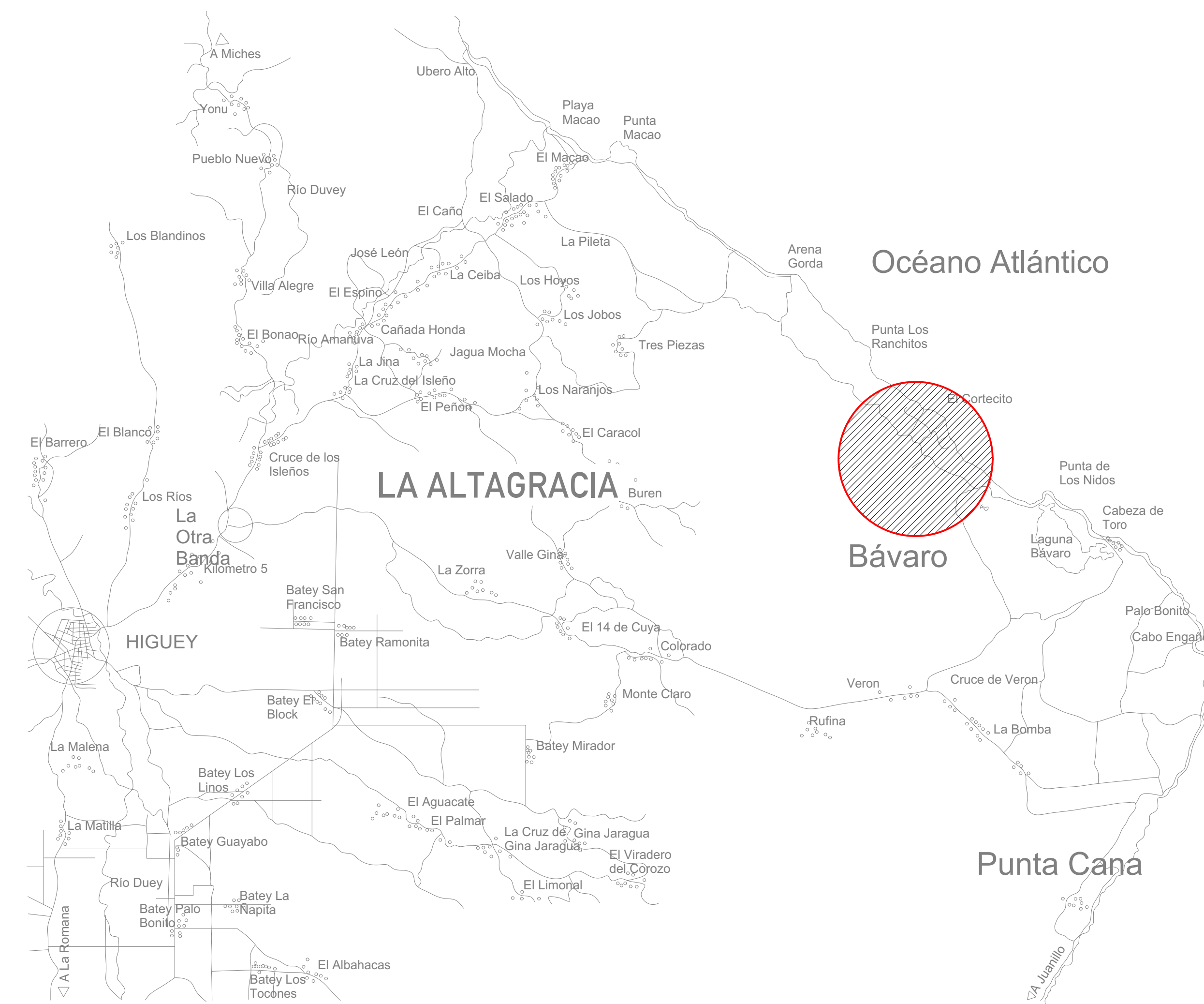
2 Localización en la ciudad S/E