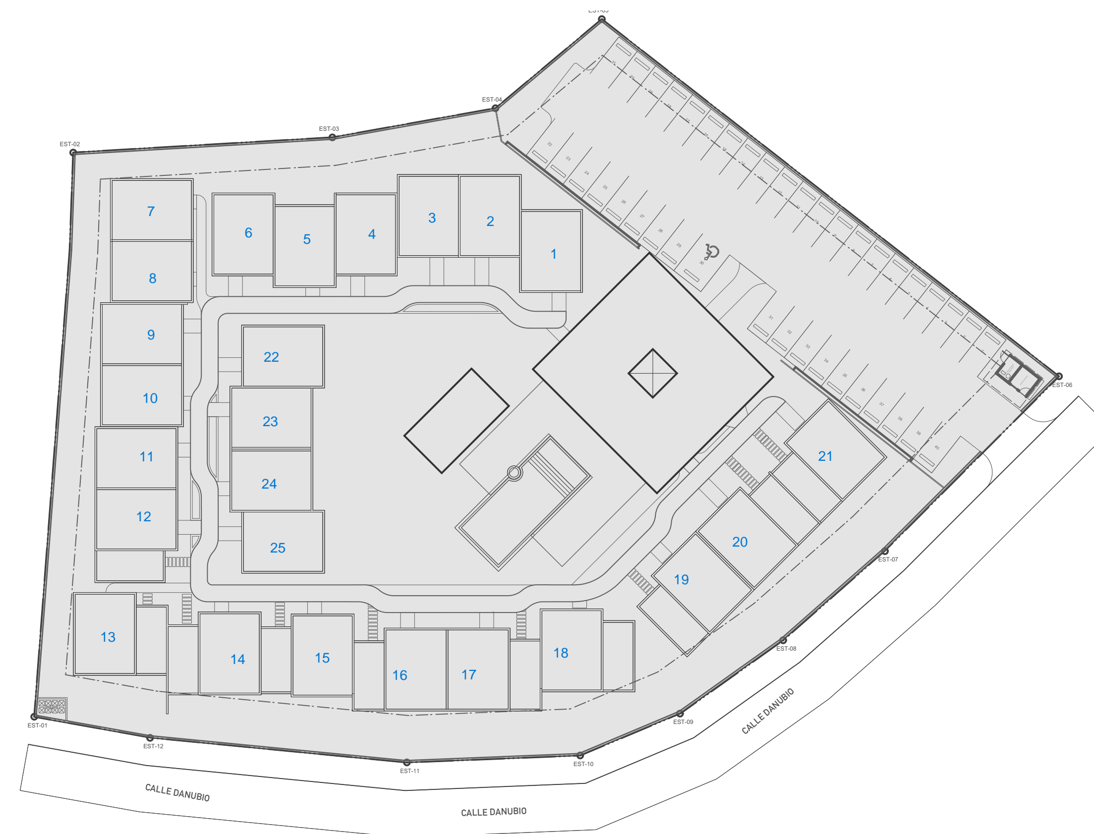
4 Ubicación S/E

ARQUITECTURA Arq. Byron Rodríguez C-27355