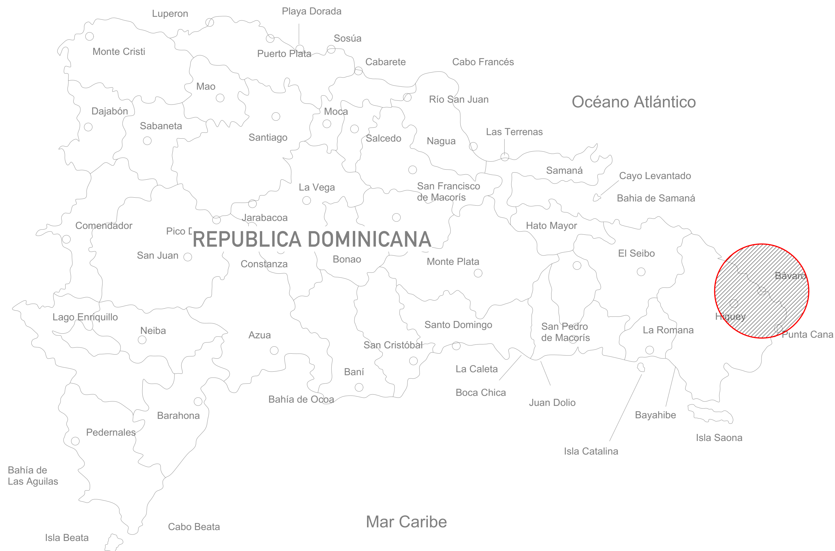
1 Localización Nacional S/E