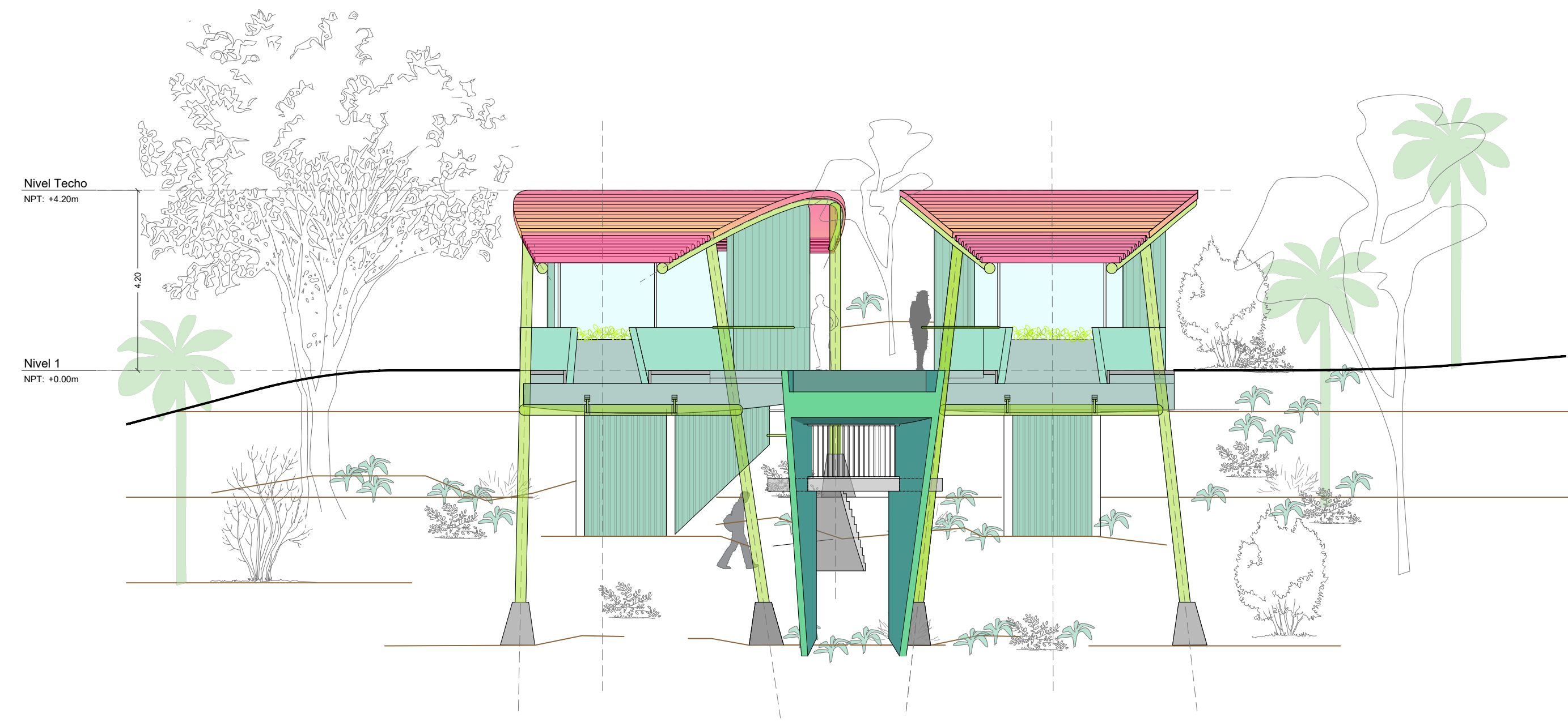
4 ELEVACIÓN POSTERIOR 1: 100

Nota general: Dimensiones definidas en planos de arquitectura, referidas en metros en planos generales y en milímetros y pulgadas en detalles. No se debe escalar este dibujo. Los datos arquitectónicos no aceptan responsabilidades sobre dimensiones obtenidas de la medición directa o realizada sobre este dibujo y no se deben tomar estas medidas como verdaderas. Si no existe escalación numérica, el receptor debe la responsabilidad de interpretar los datos de acuerdo al Acordado o a través de mediciones directas con la realidad física. El trabajo de los elementos estructurales o de instalaciones debe contrastarse siempre con los planos específicos de esos disciplinas. La propiedad intelectual de la documentación gráfica y escrita contenida en este documento pertenece a Luis Vidal + arquitectos. Queda totalmente prohibida su reproducción total o parcial sin autorización de sus propietarios.