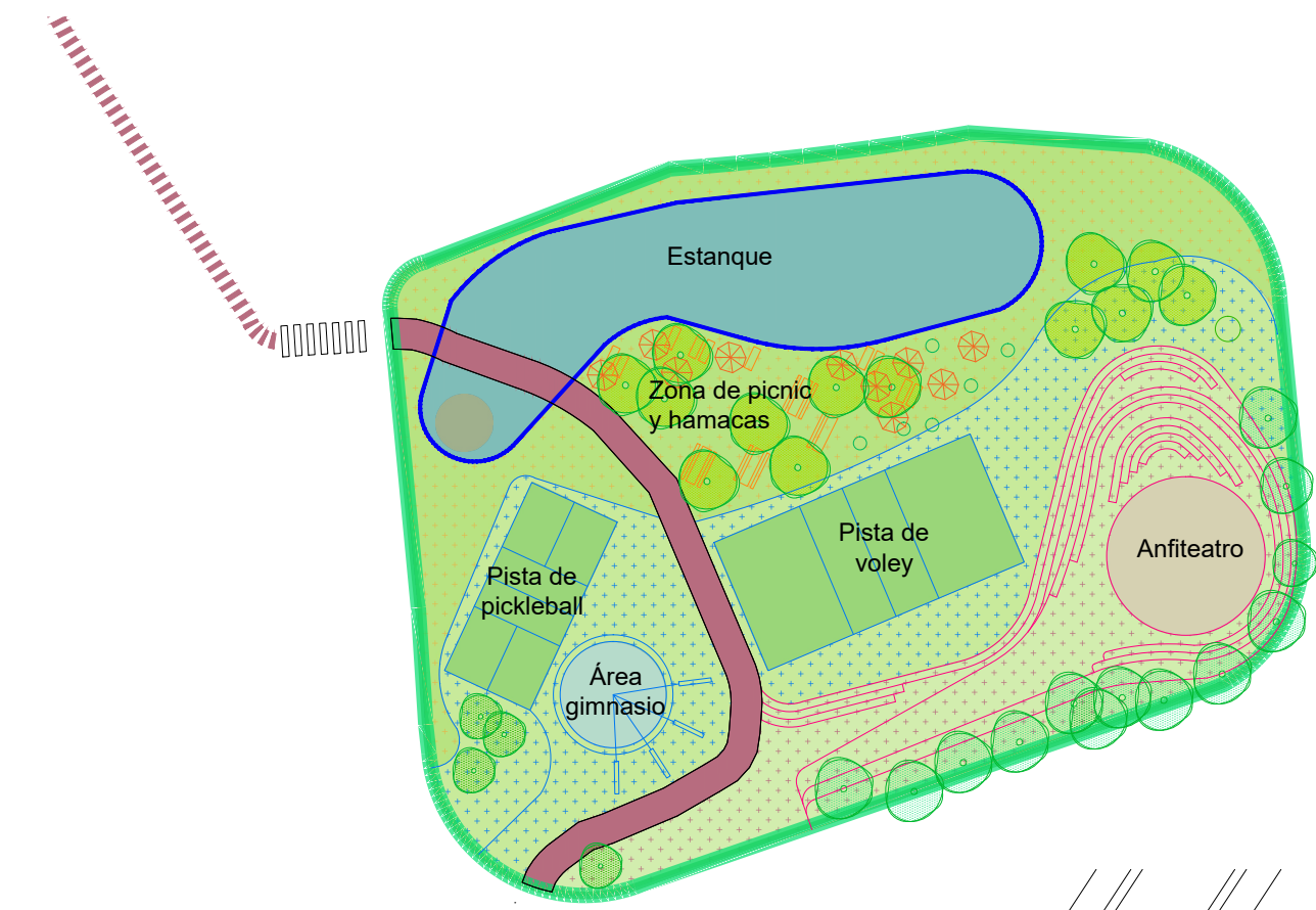
2 ÁREA RECREATIVA A1 1 : 500