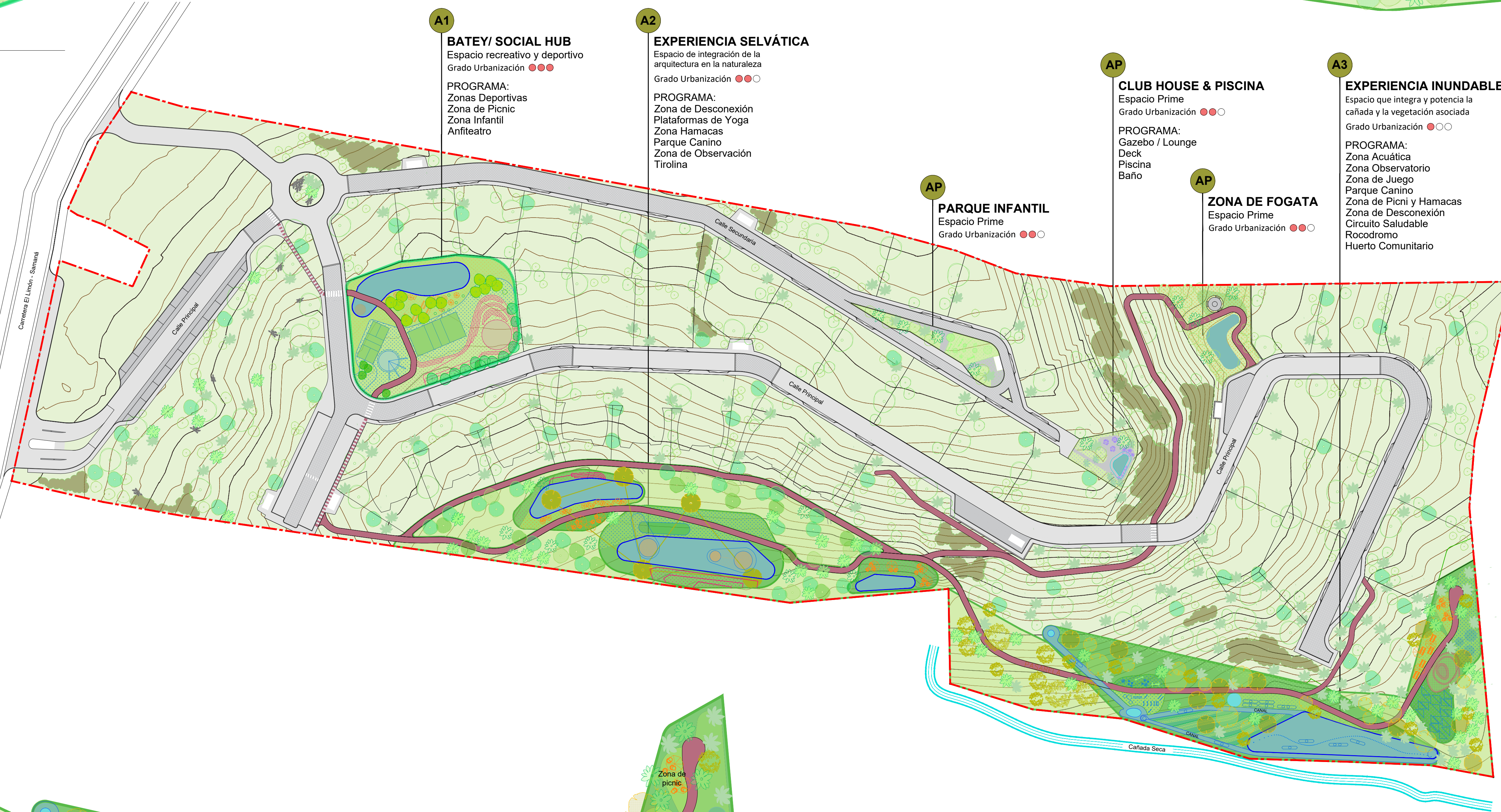
1 PLANTA DE PAISAJISMO 1 : 800