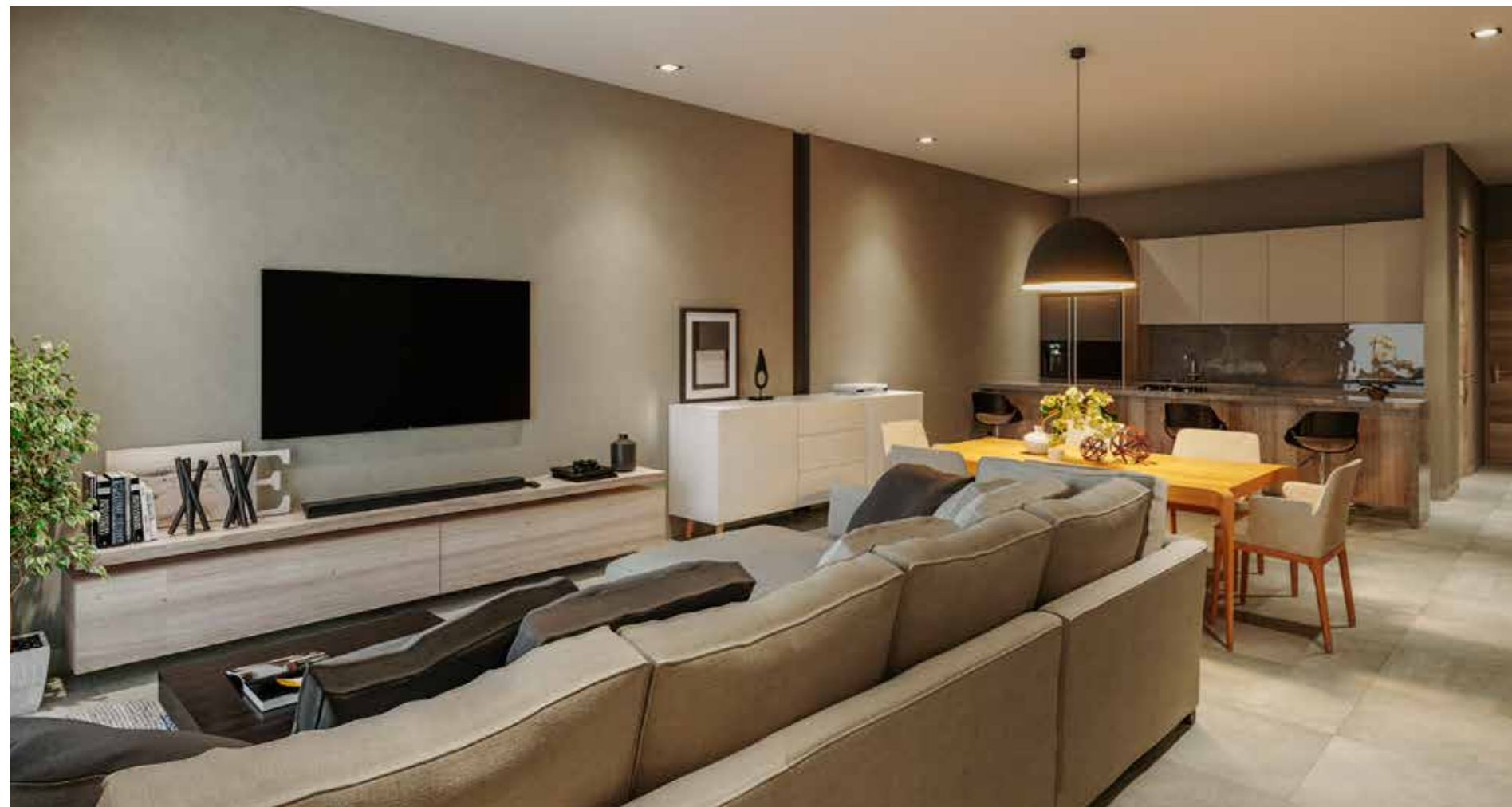
Sala comedor Prototipo 115a