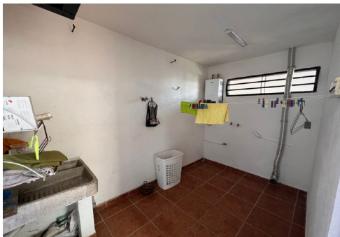
PATIO DE SERVICIO