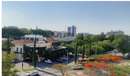
VISTA DESDE DEPARTAMENTO