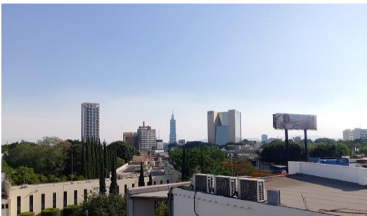
VISTA DESDE DEPARTAMENTO