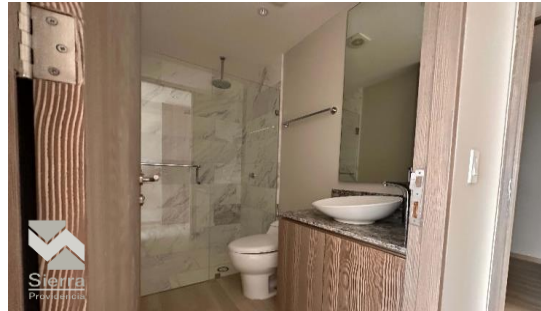
BAÑO SEGUNDA RECÁMARA