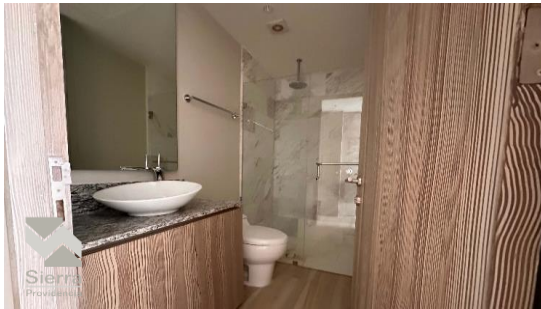
BAÑO TERCER RECÁMARA