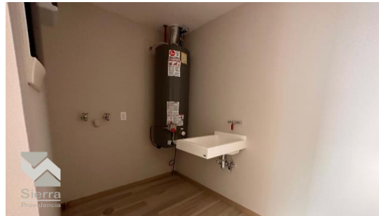
ÁREA DE LAVADO