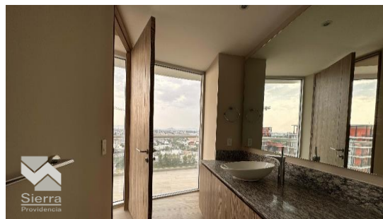
BAÑO EN RECÁMARA PRINCIPAL