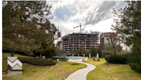
ALBERCA Y ÁREAS VERDES