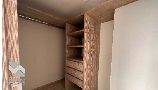
CLOSET RECÁMARA PRINCIPAL