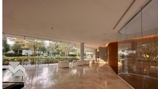
ÁREA DE NEGOCIOS