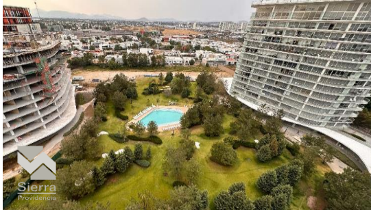
VISTA ÁREAS COMUNES