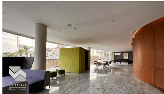
ÁREA DE NEGOCIOS