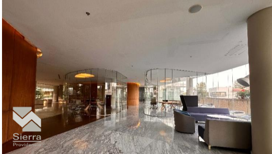
ÁREA DE NEGOCIOS