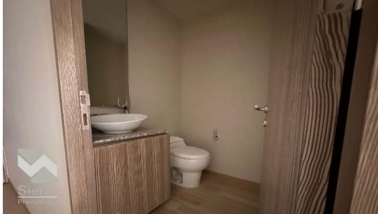
BAÑO DE VISITAS