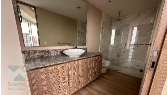
BAÑO EN RECÁMARA PRINCIPAL