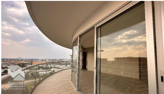
BALCÓN RECÁMARA PRINCIPAL