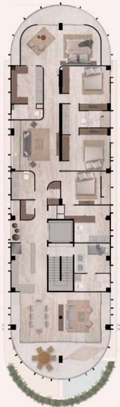
PENTHOUSE TOP 251.5 m 2