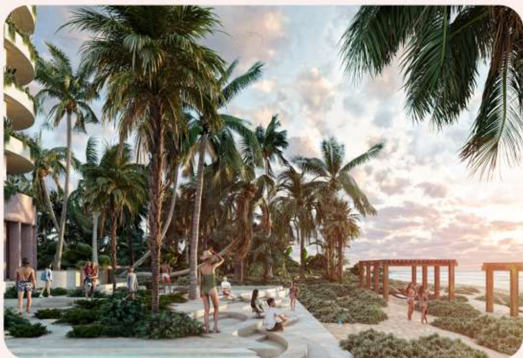
Puesta de Sol Sunset Theater