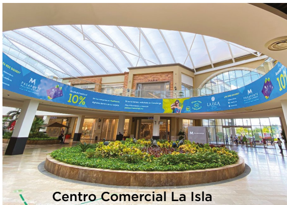
Centro Comercial La Isla