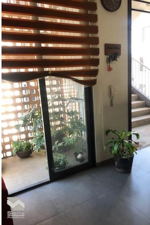
INGRESO Y PATIO