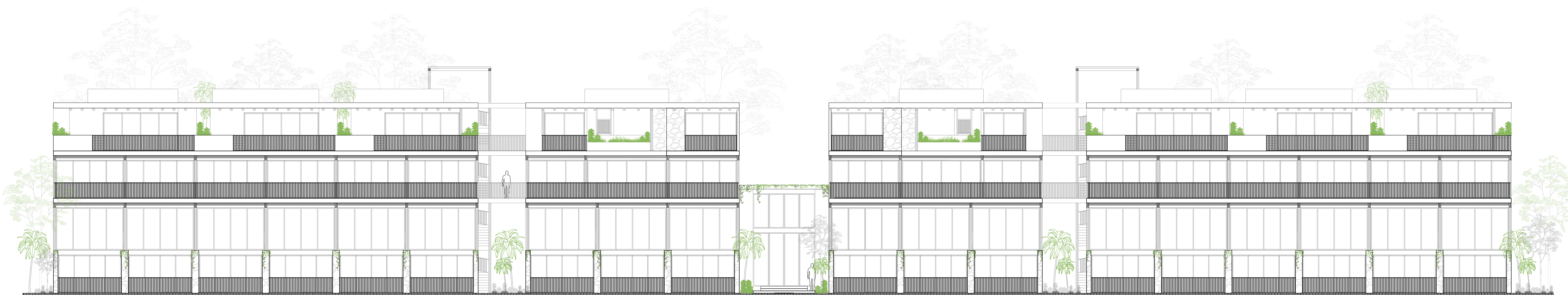
FACHADA INTERNA TRASERA