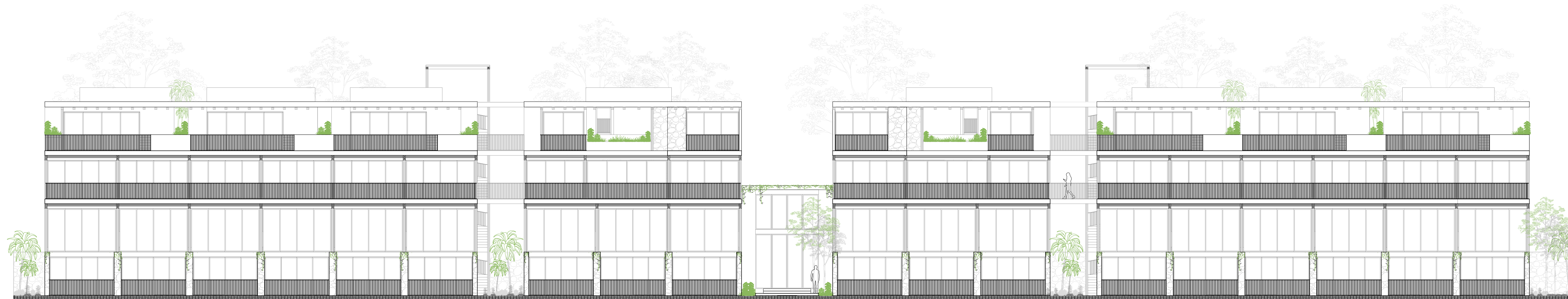
FACHADA INTERNA PRINCIPAL