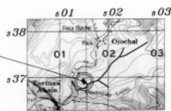
UBICACIÓN GEOGRÁFICA HOJA CORONADO Escala 1:50000