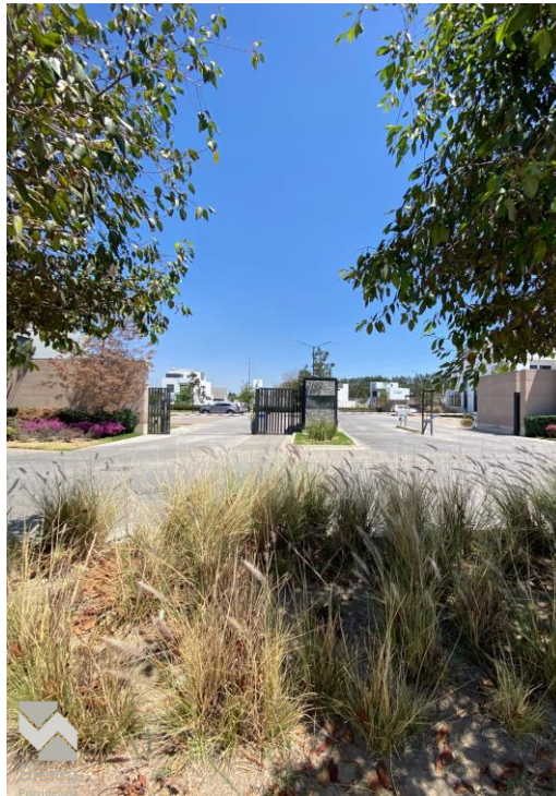
INGRESO A CONDOMINIO