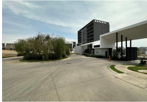
INGRESO COTO CANTERA