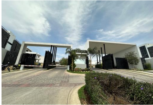
INGRESO AL COTO