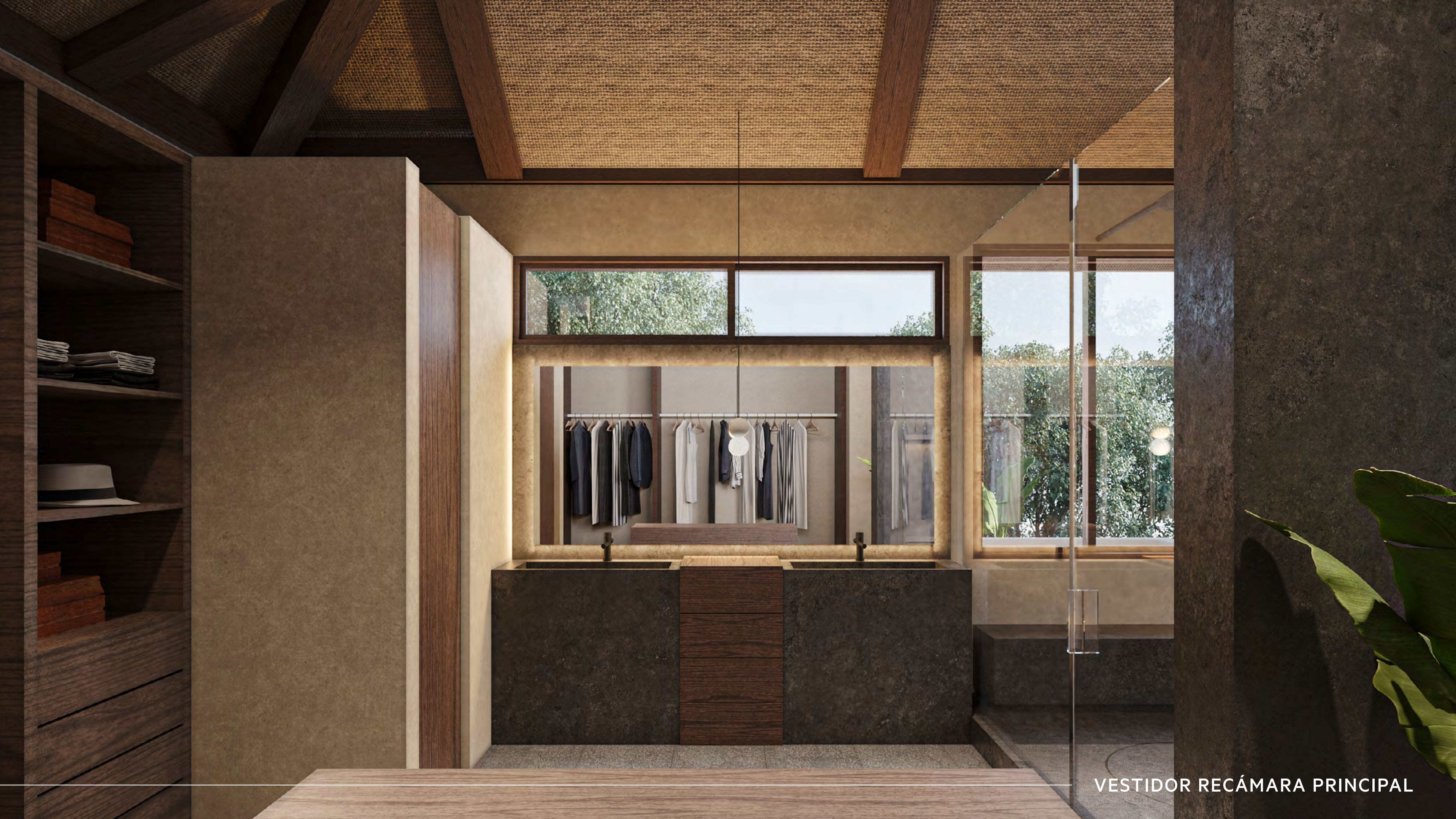
VESTIDOR RECÁMARA PRINCIPAL