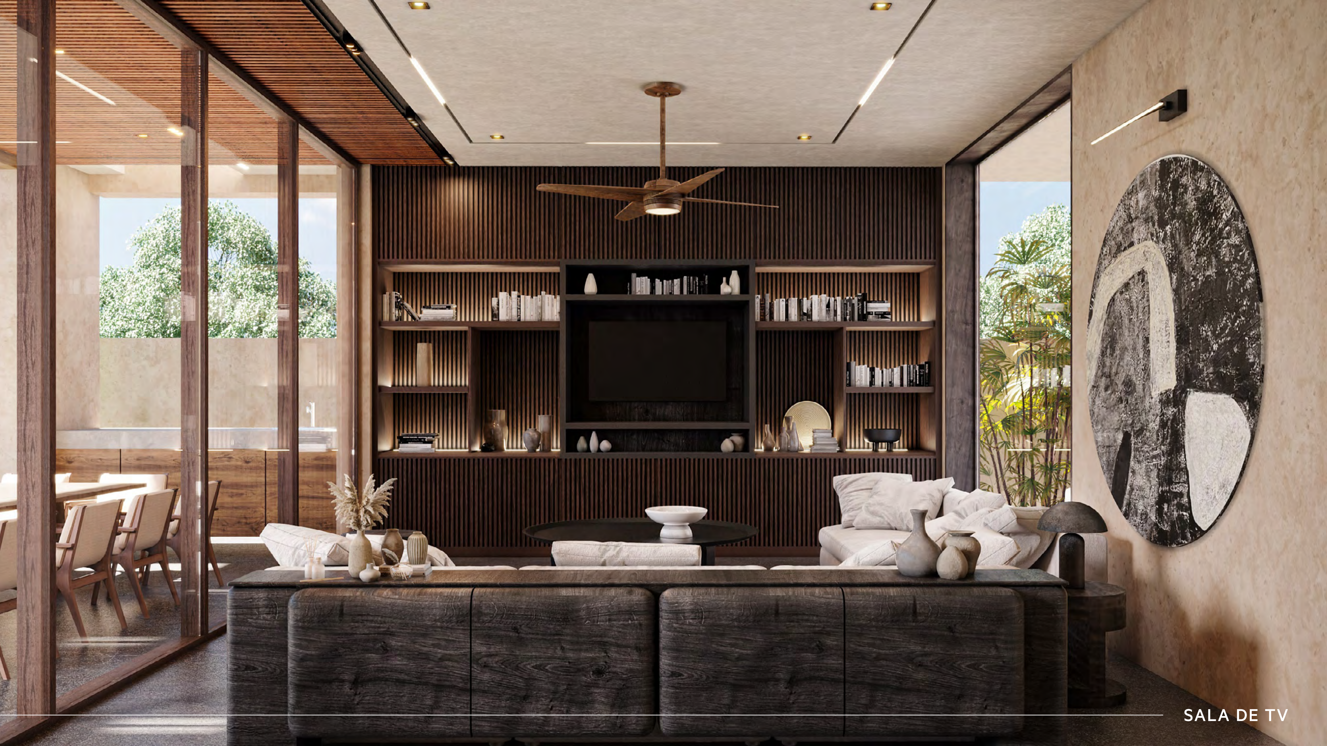
SALA DE TV