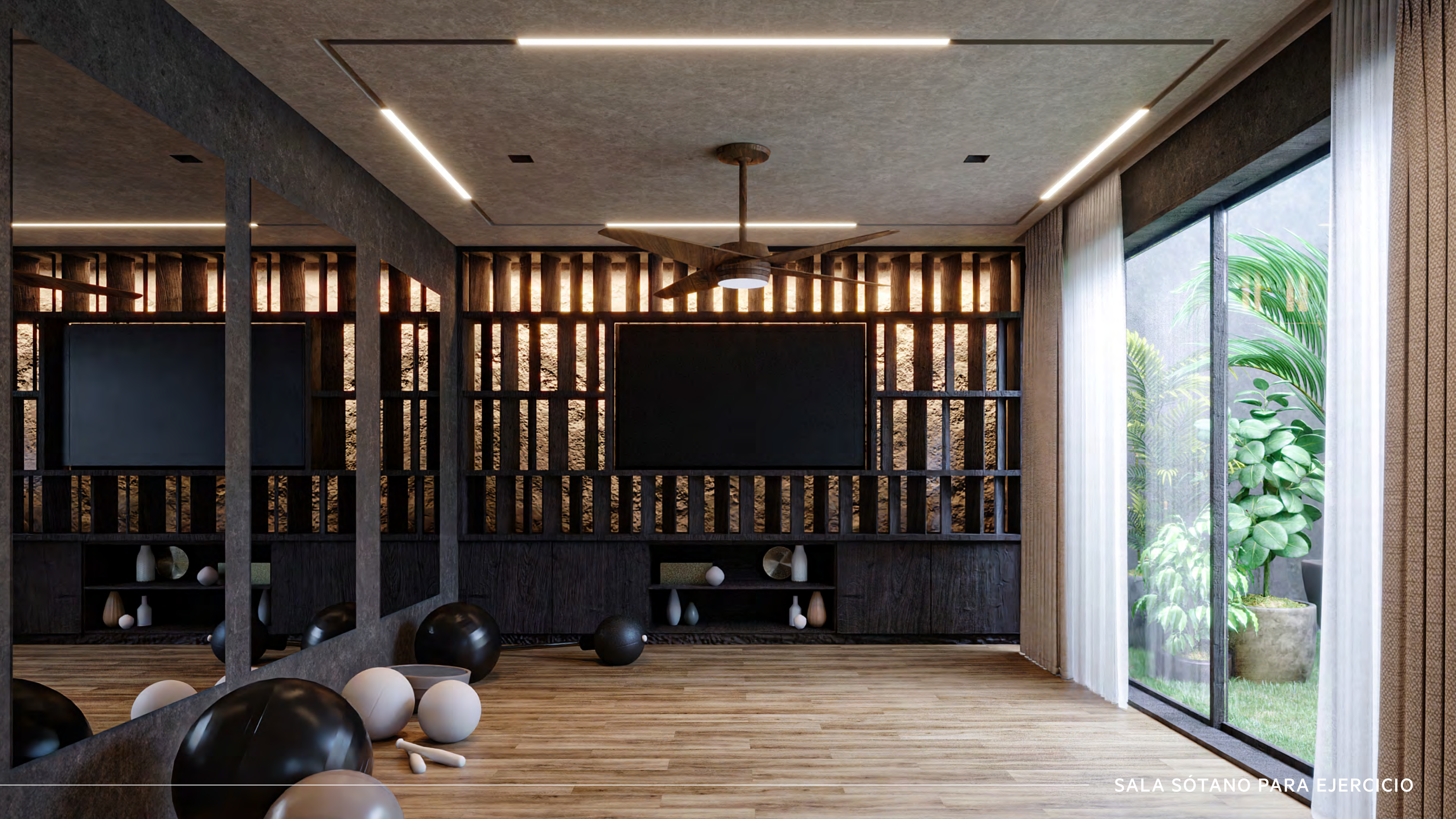
SALA SÓTANO PARA EJERCICIO