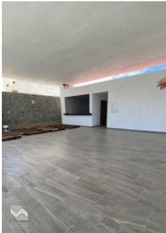
TERRAZA PARA EVENTOS