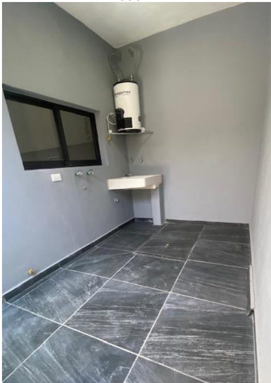
ÁREA DE LAVADO