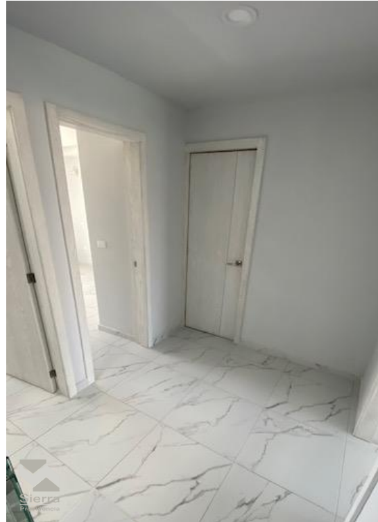
DISTRIBUCIÓN PLANTA ALTA