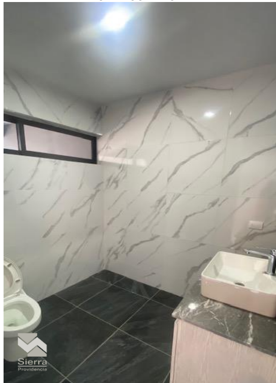
BAÑO PLANTA BAJA