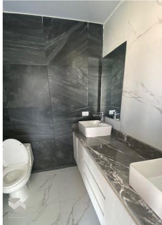
BAÑO RECÁMARA PRINCIPAL