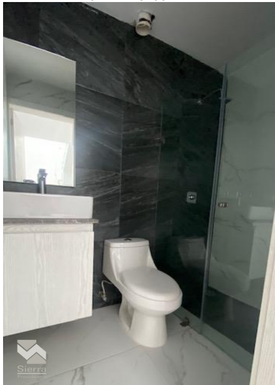
BAÑO RECÁMARA SECUNDARIA