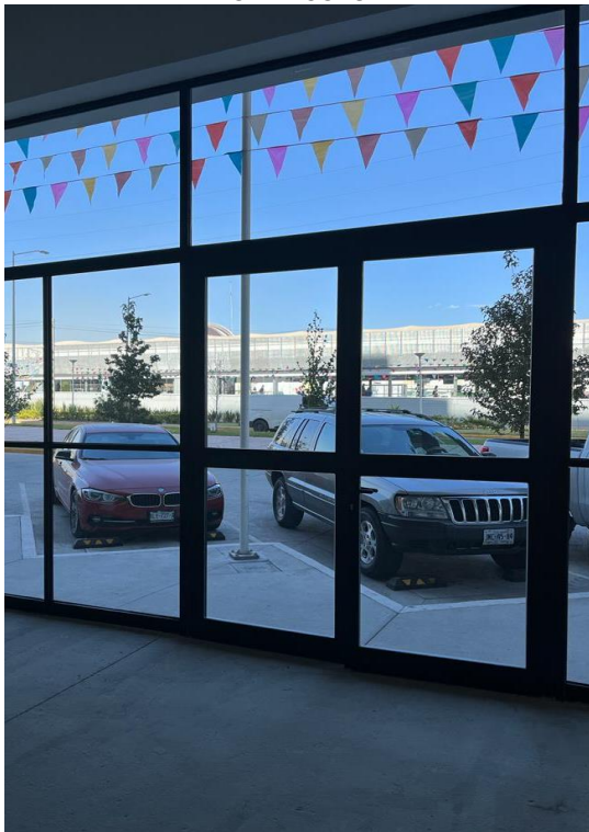
VISTA AL EXTERIOR