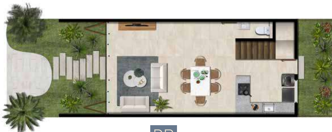
PB 62.56 m 2