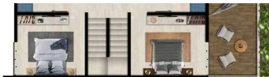
N1 61.8 m 2