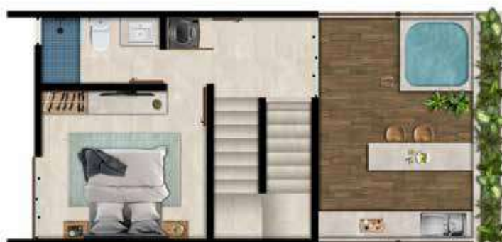
N2 51.8 m 2