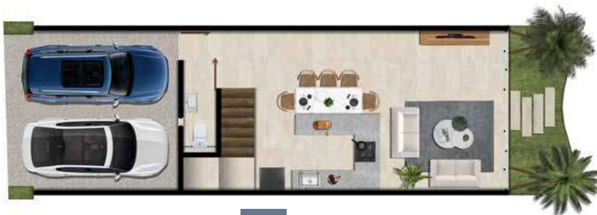
PB 61.8 m 2