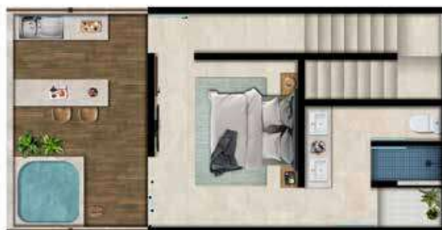
N2 51.5 m 2