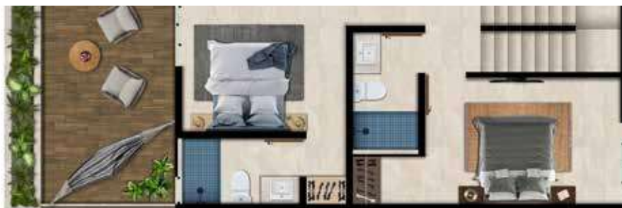
N1 62.56 m 2