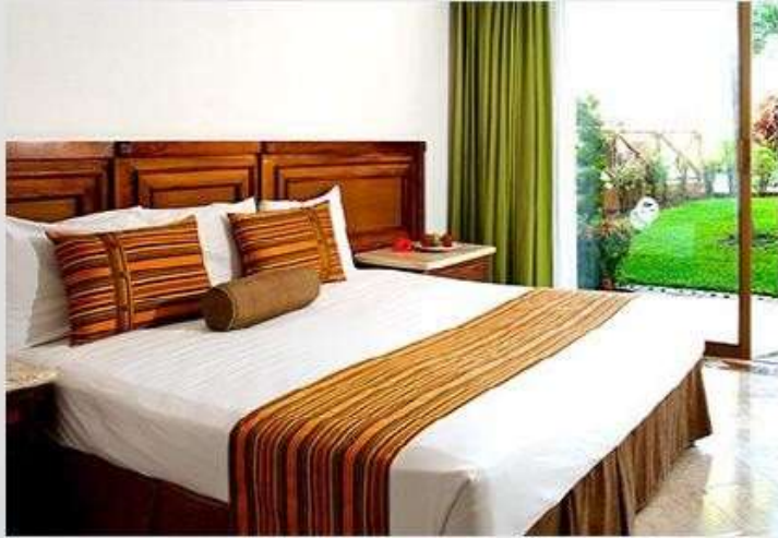
Hotel Las Palmas Puerto Vallarta