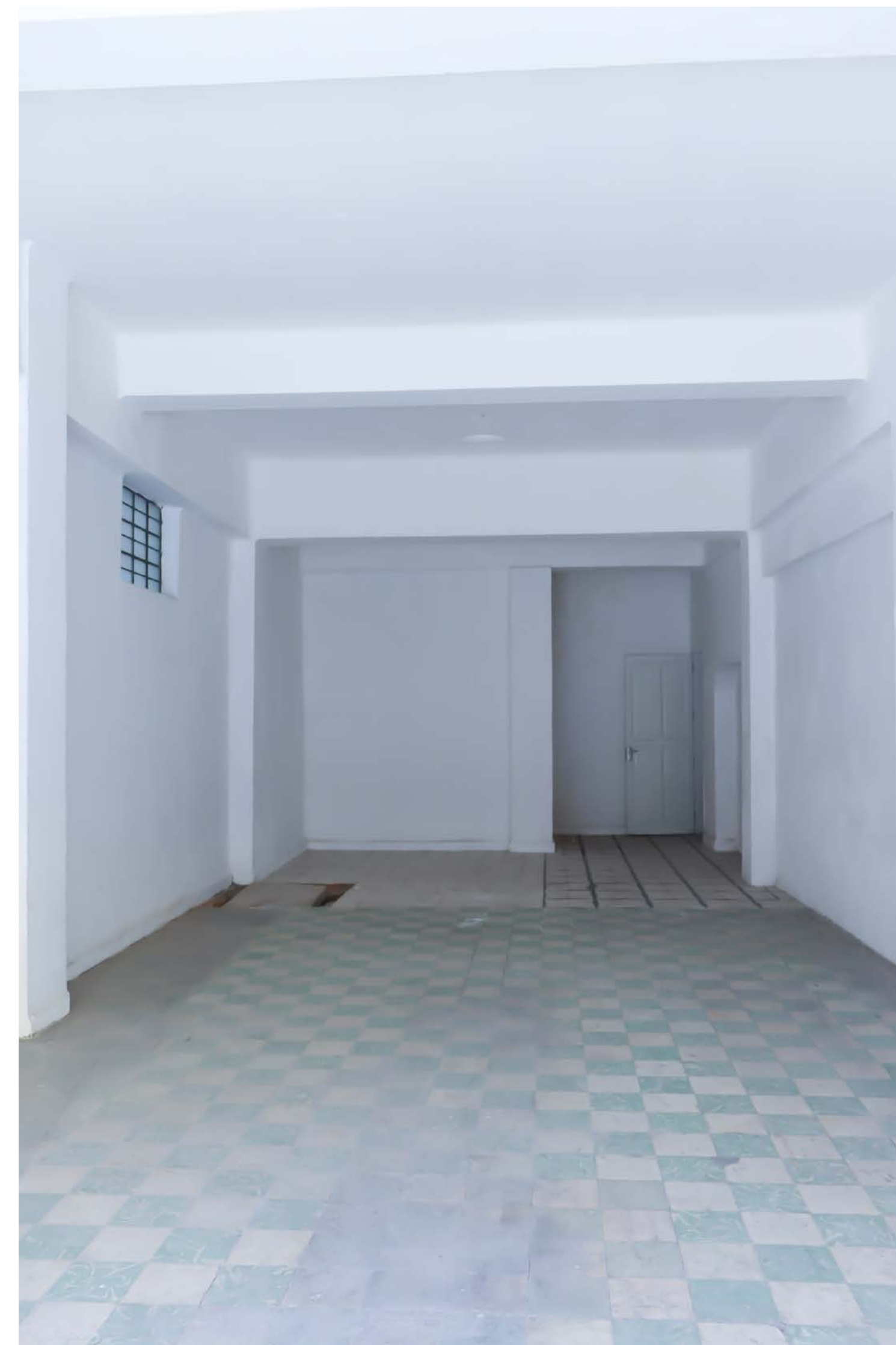
LOCALES | EL PARRAL