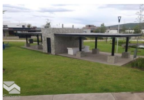
SALON DE EVENTOS