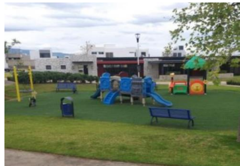
PARQUE CON JUEGOS