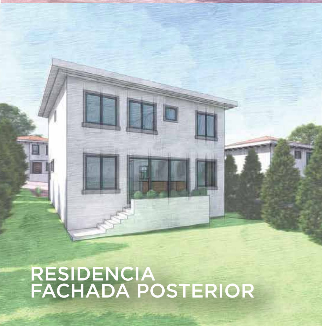
RESIDENCIA FACHADA POSTERIOR