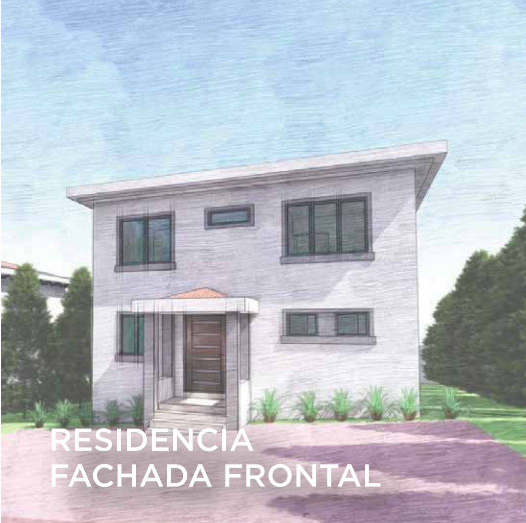
RESIDENCIA FACHADA FRONTAL