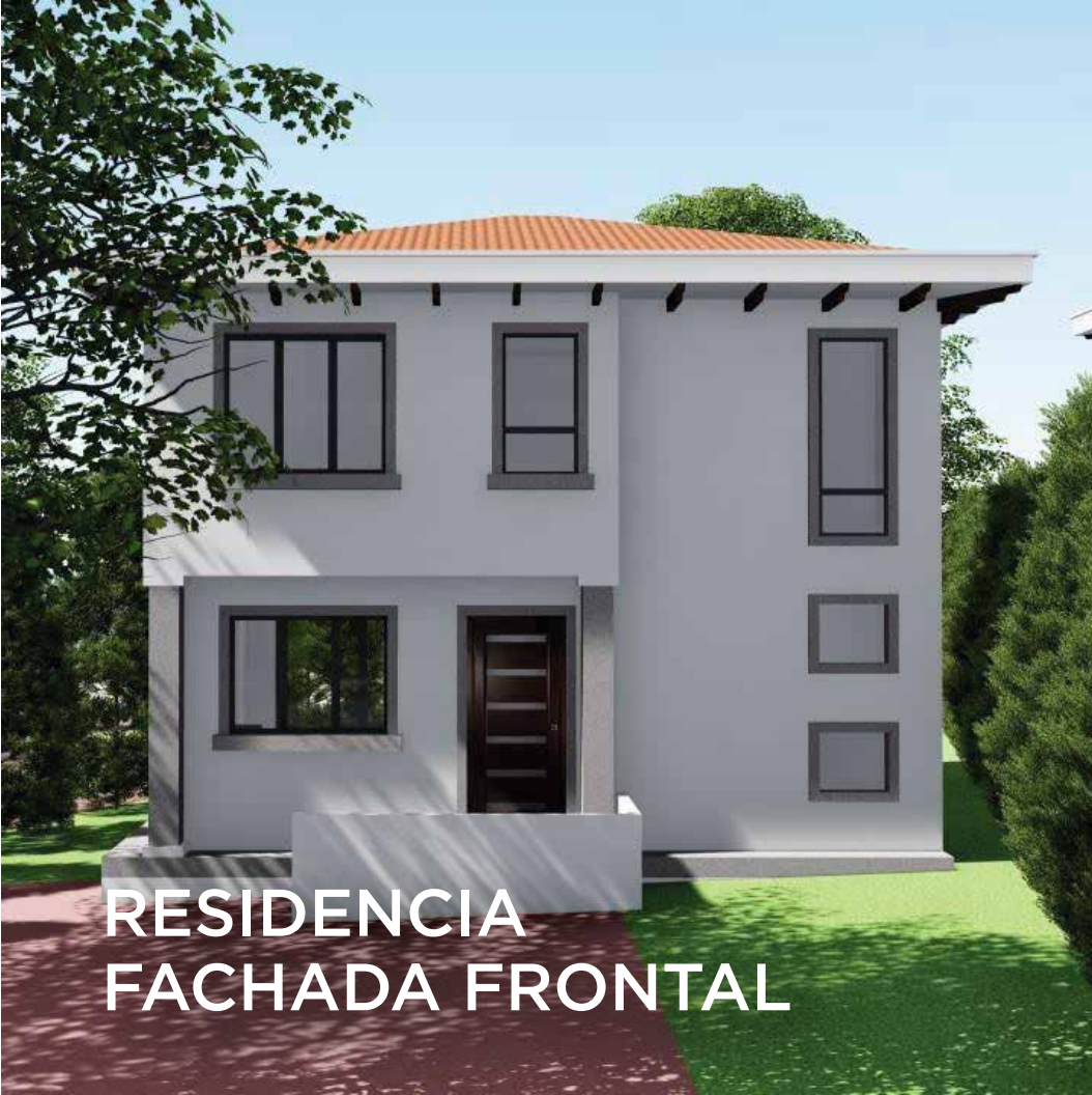
RESIDENCIA FACHADA FRONTAL