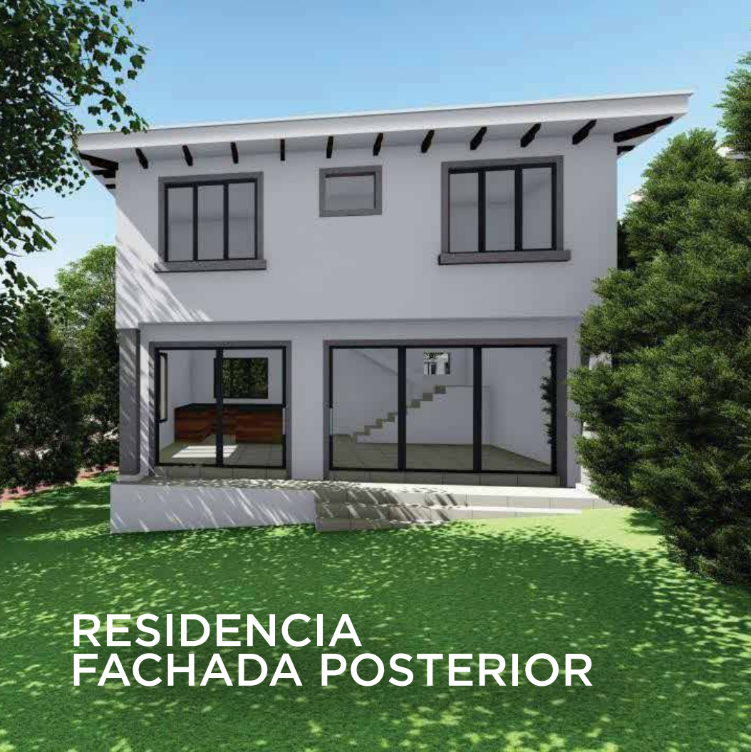
RESIDENCIA FACHADA POSTERIOR