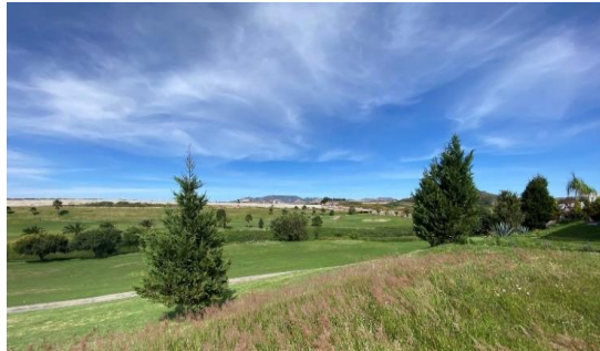
VISTA AL CAMPO DE GOLF