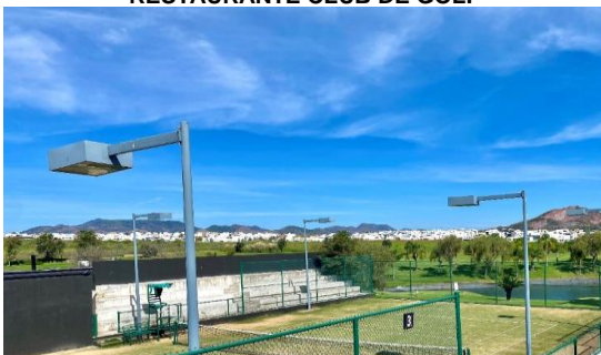
CANCHAS DE TENIS