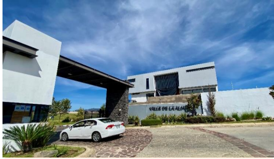
INGRESO AL COTO