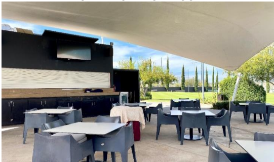
RESTAURANTE CLUB DE GOLF