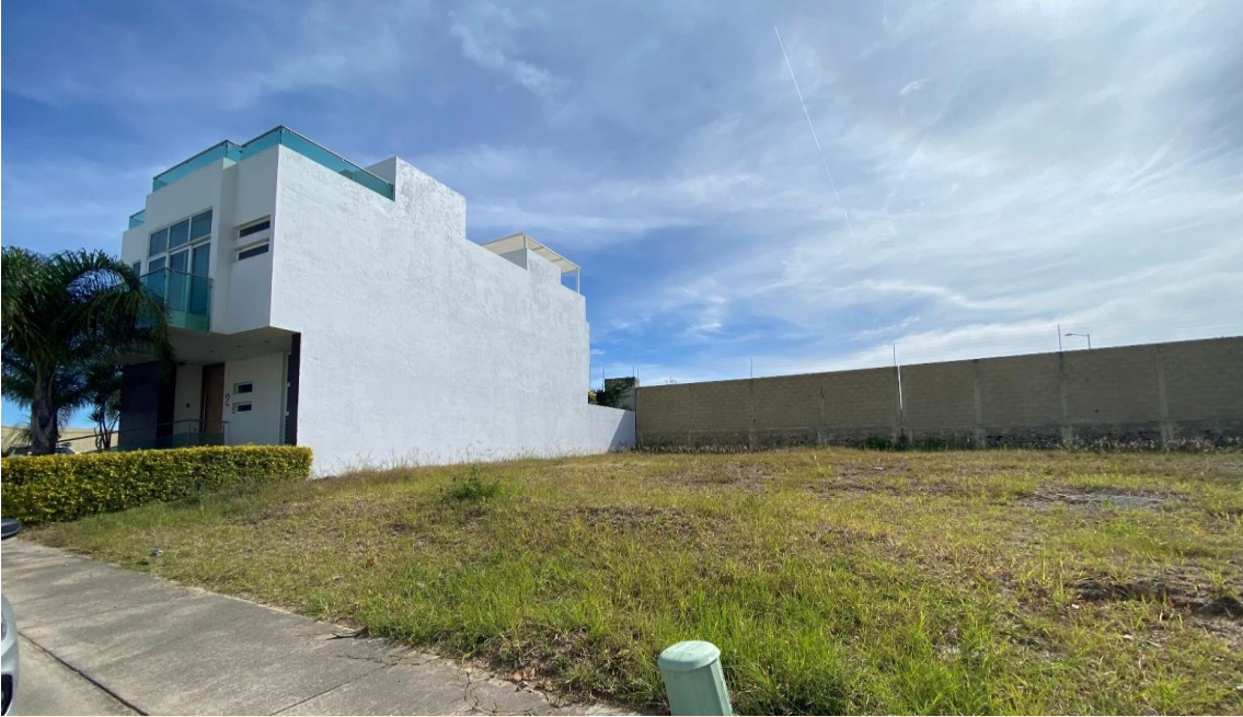
VISTA LATERAL TERRENO LOTE 3