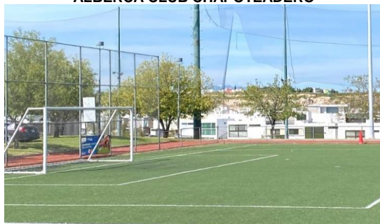
CANCHAS DE FUT