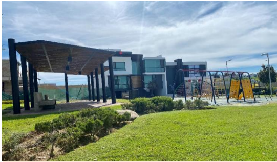
ÁREA DE JUEGOS