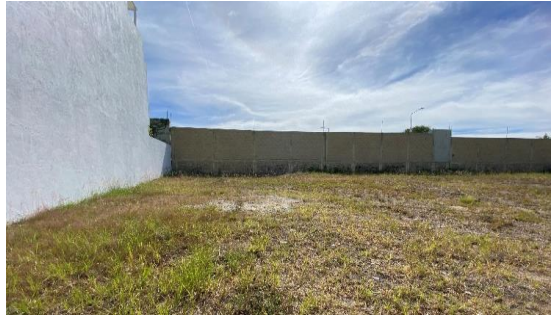
VISTA FRONTAL TERRENO LOTE 3