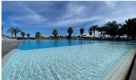
ALBERCA CLUB CHAPOTEADERO