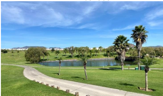
VISTA AL CAMPO DE GOLF