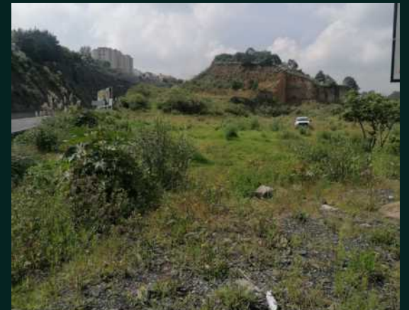
VISTAS DE LAS TERRAZAS DEL TERRENO