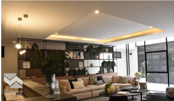
LOBBY DE TORRE