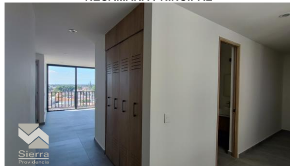
AREA DE LAVADO