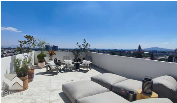
TERRAZA DE LECTURA