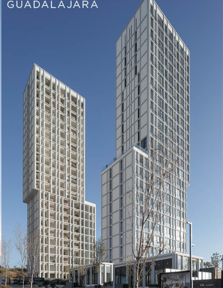
VENTURA / GUADALAJARA