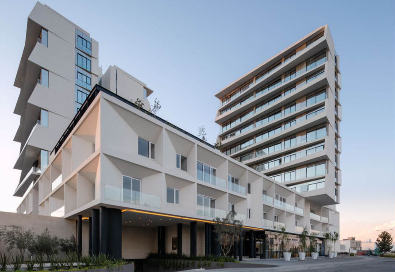
VITIA LA TOSCANA / GUADALAJARA