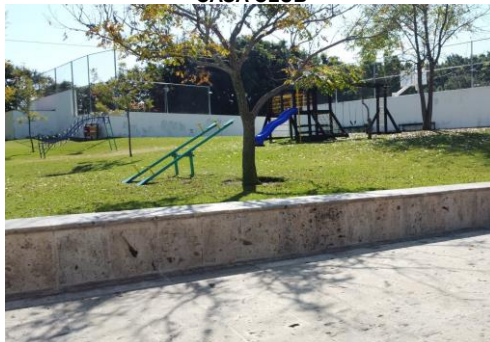
ÁREA DE JUEGOS