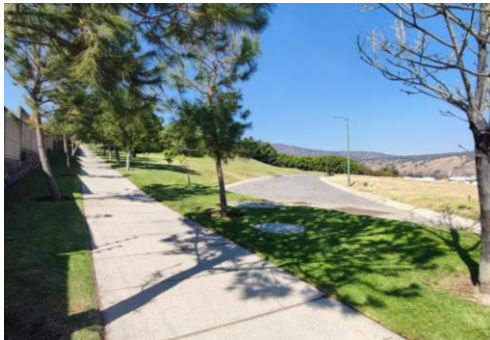
PARQUE LINEAL/ PISTA DE JOGGING