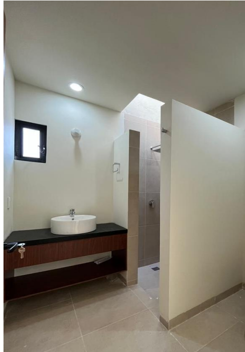
BAÑO RECÁMARA PRINCIPAL