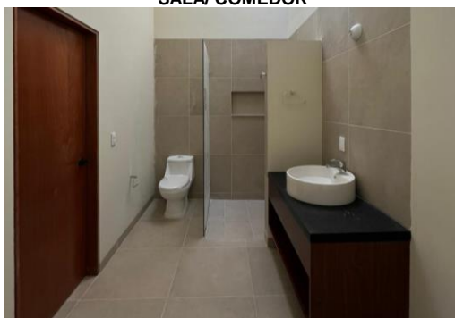
BAÑO COMPLETO VISITAS