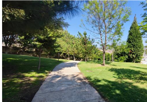
PARQUE LINEAL/ PISTA DE JOGGING