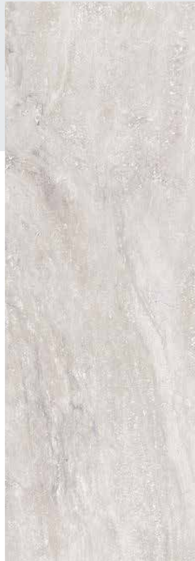
Porcelanato en baños y cocina