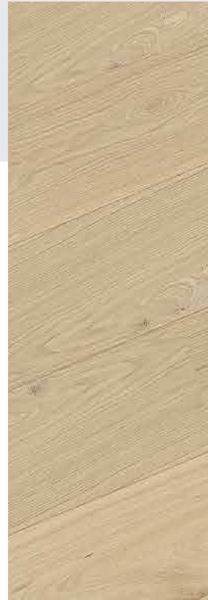
Madera de ingeniería