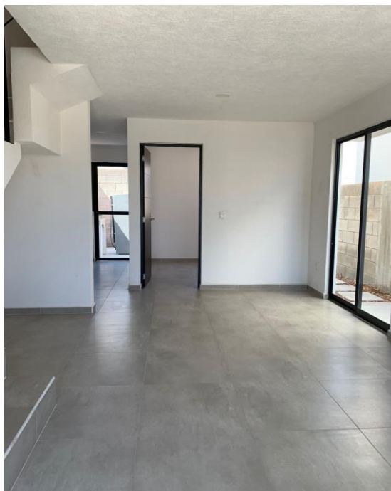
SALA / COMEDOR