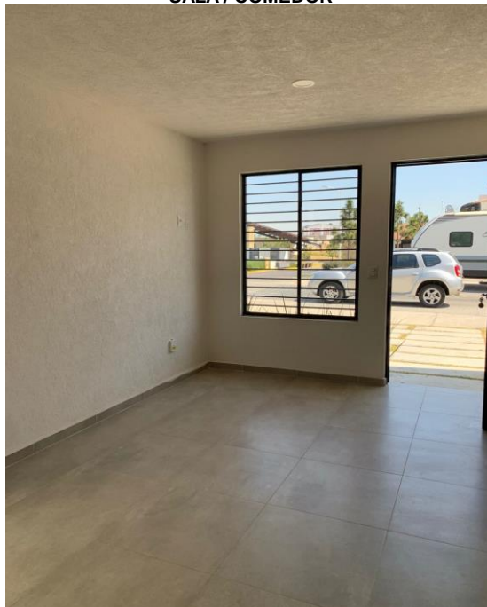
SALA / COMEDOR