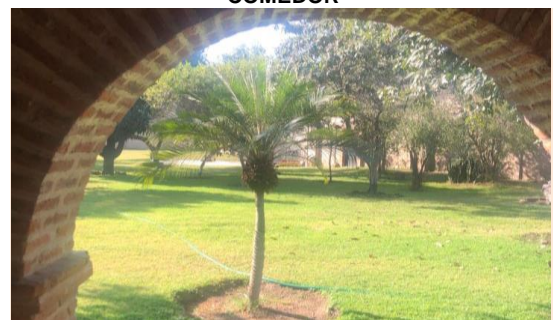
TERRAZA / JARDÍN