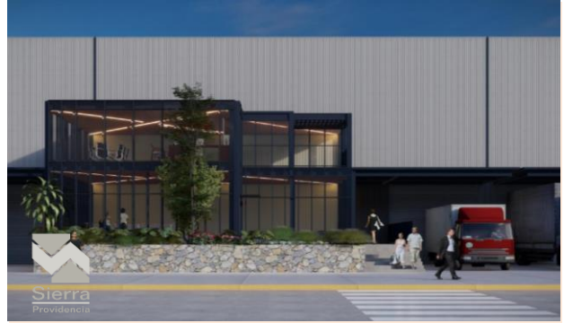
NAVE TIPO A