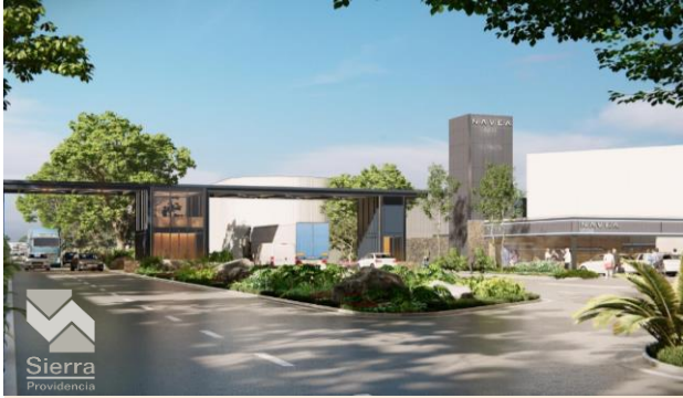
CASETA DE INGRESO