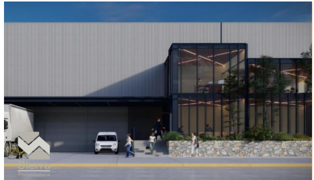
NAVE TIPO C