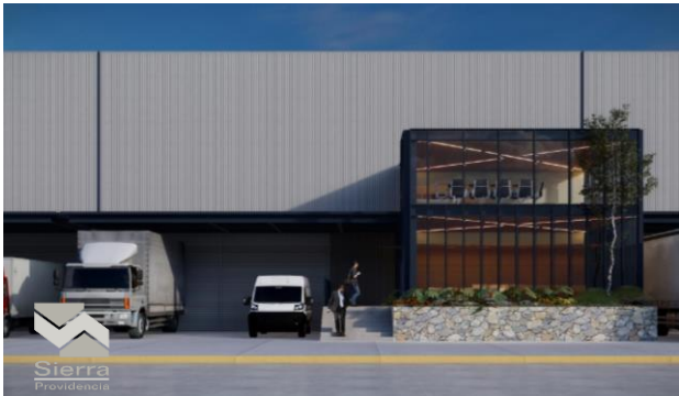
NAVE TIPO B