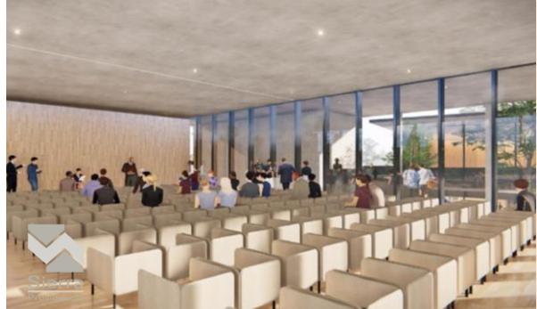
SALÓN DE USOS MÚLTIPLES