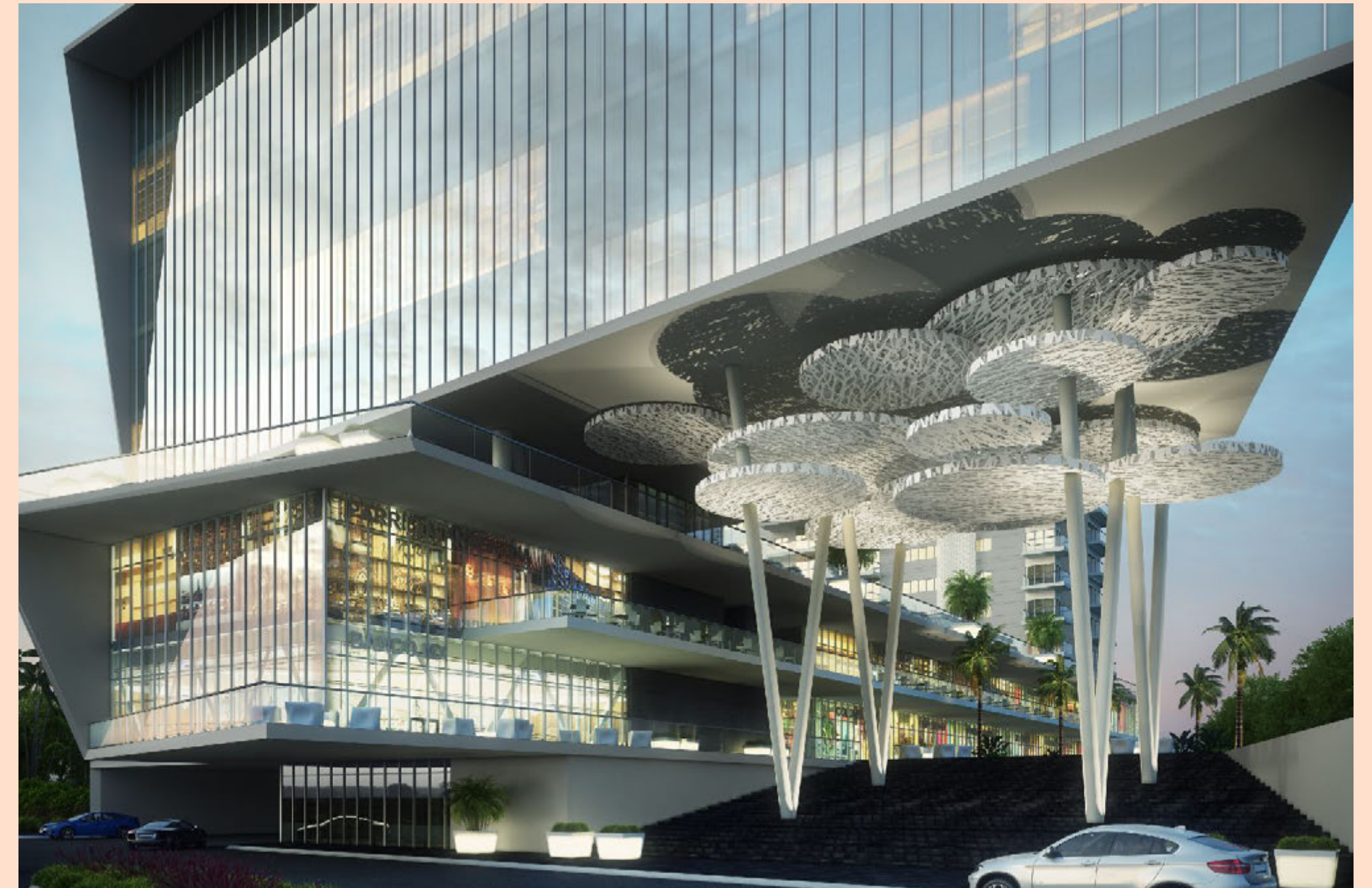
ANKOR, Villahermosa, Tabasco.

GIRA no desarrolla proyectos inmobiliarios, crea soluciones inmobiliarias que el mercado está demandando. Con más de 15 años de experiencia en el sector y un importante historial de proyectos inmobiliarios, GIRA respalda el desarrollo de Nía Tower.