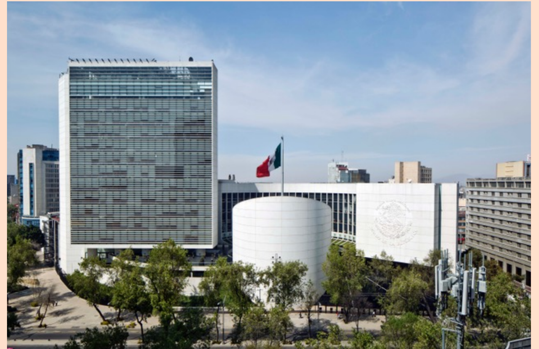
Senado de la República.

Somos un equipo que conjuga experiencia y juventud, siempre conscientes de que la arquitectura sirve para hacer feliz a la gente.