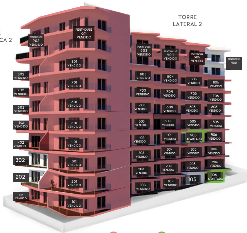
TORRE LATERAL 2