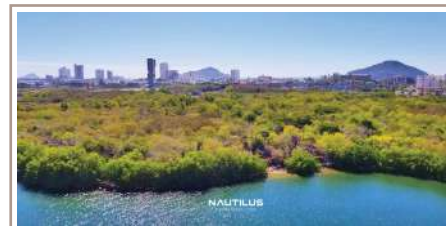
VISTA PRINCIPAL DE CONDOMINIO